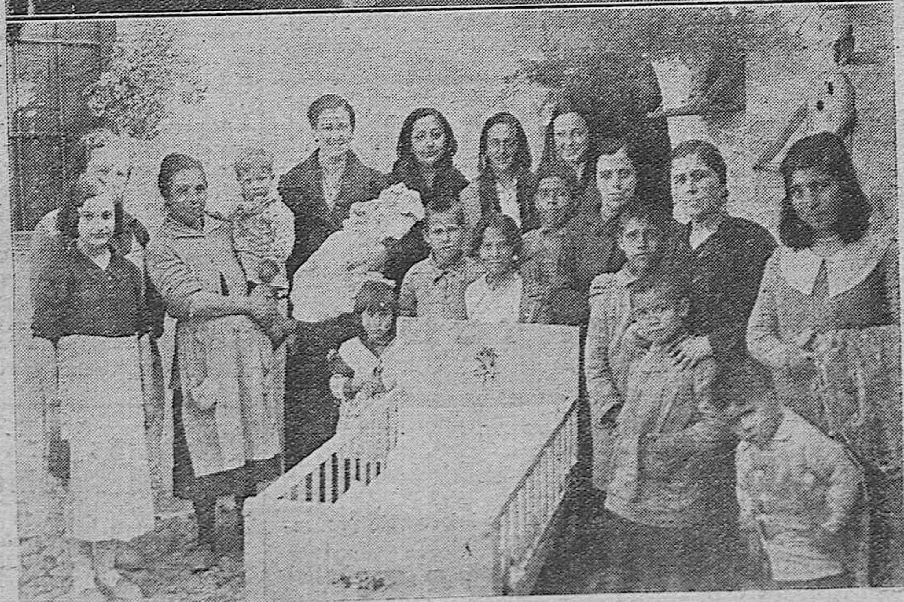
Bellas señoritas entregando varias cunas con las envueltas correspondientes a familias necesitadas, y cuyos últimos hijos nacieron en fecha próxima al día de Nochebuena.