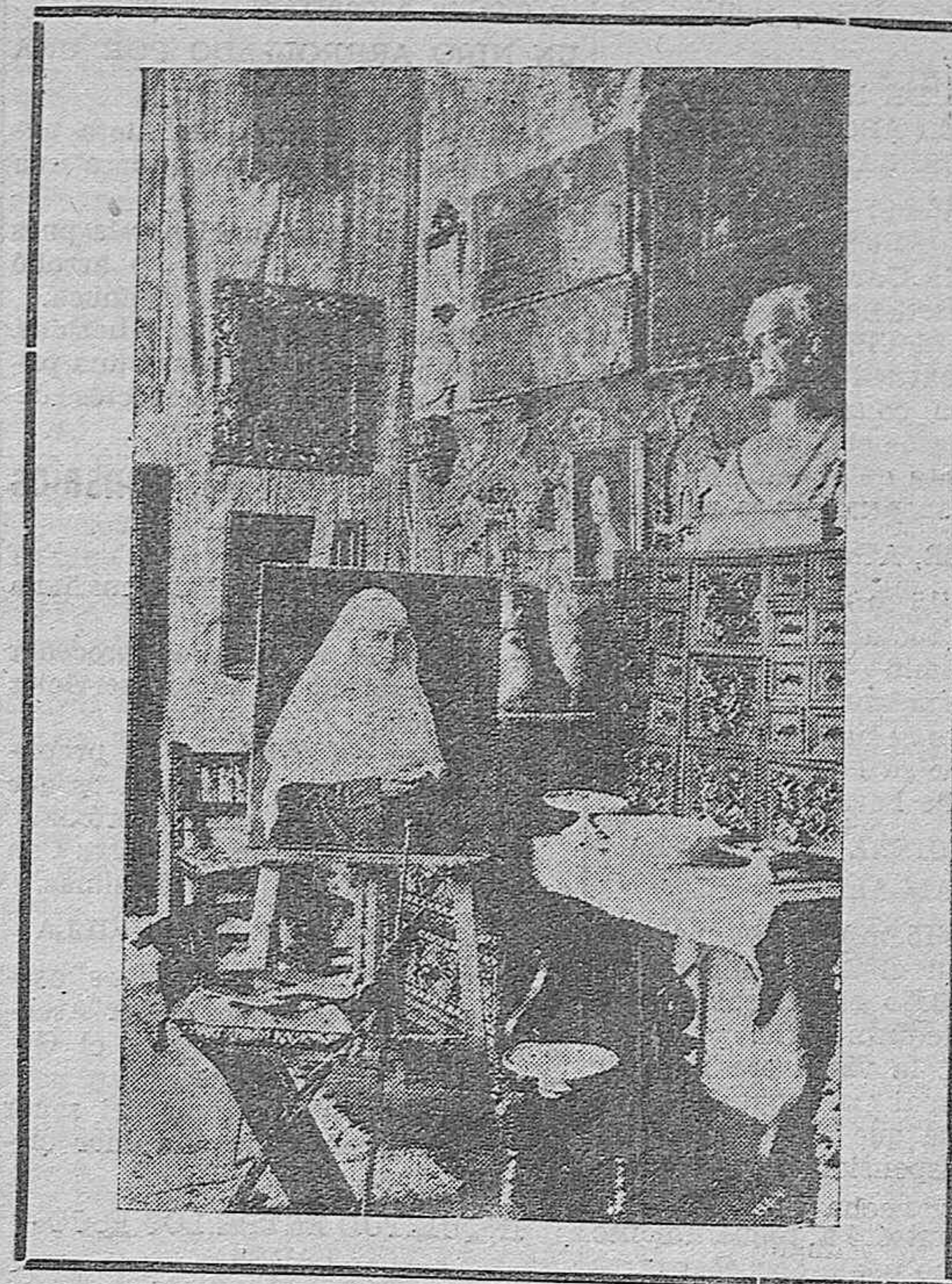
Un detalle del estudio de Romero de Torres.—En el caballete el último lienzo donde trabajaba el artista.—Al lado la paleta silenciosa, donde duerme para siempre la maravilla creadora del pintor.