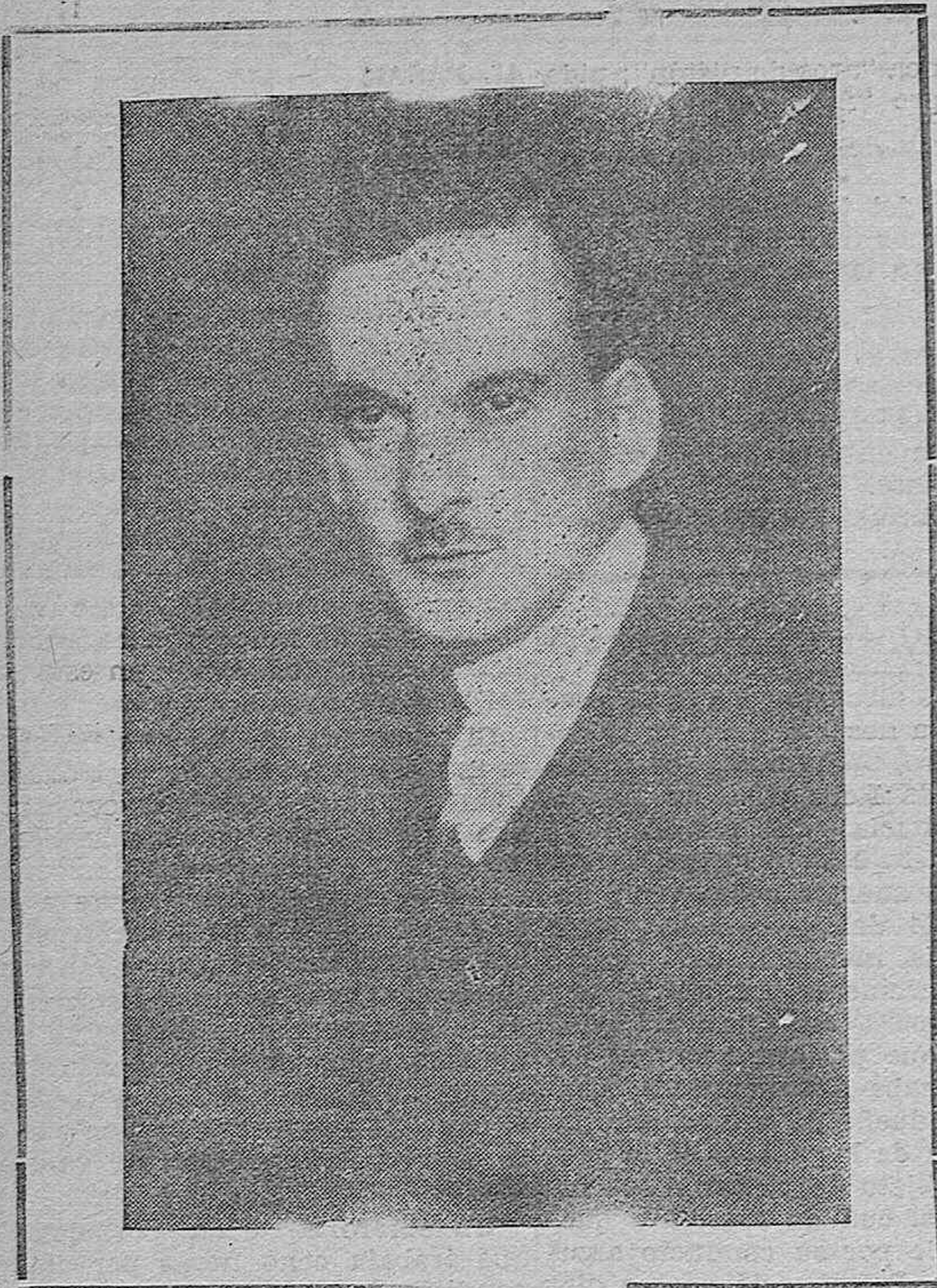
El gran pintor poeta de Córdoba.