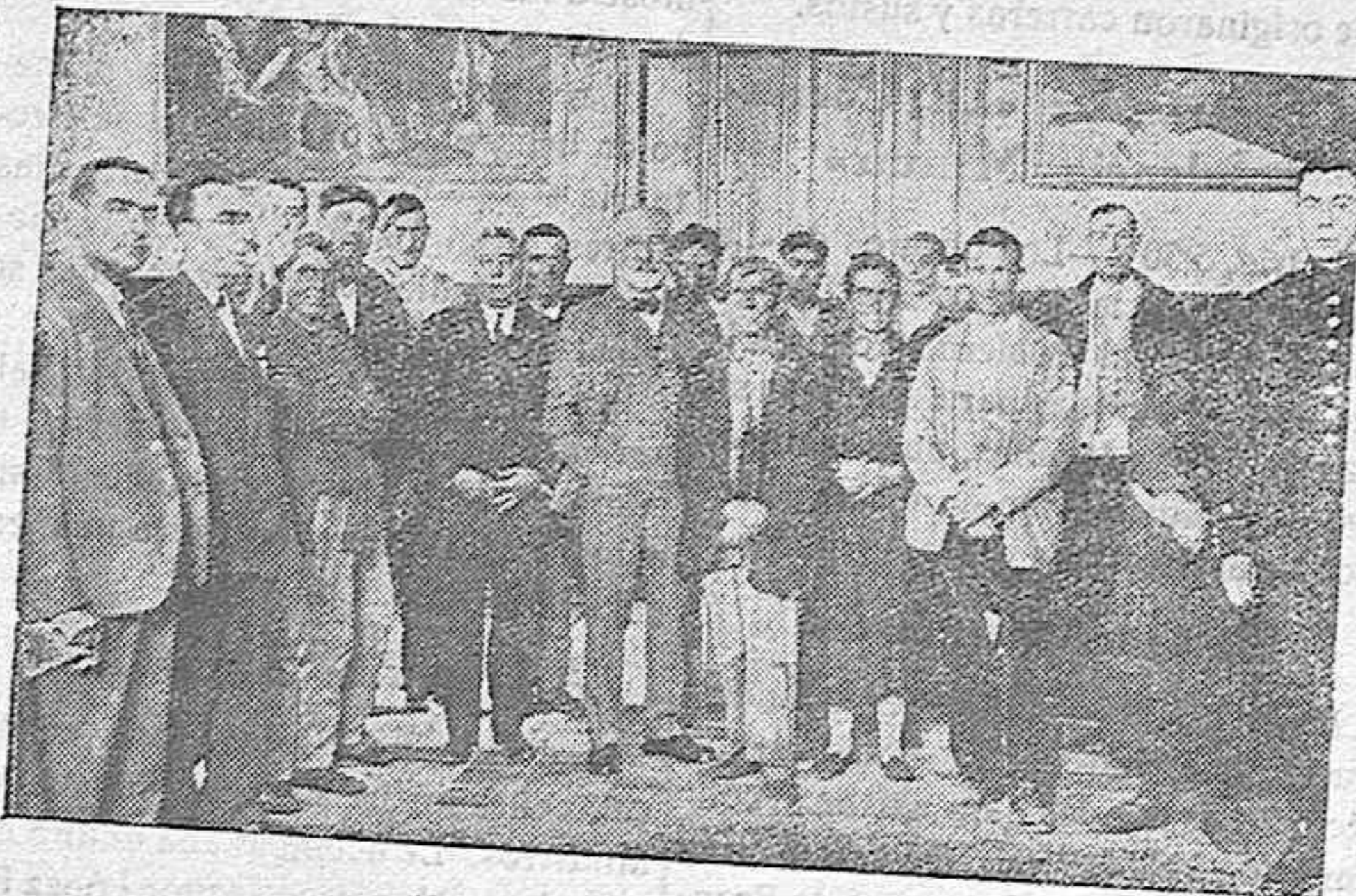
El gobernador civil entregando el importe de la suscripción popular a los damnificados por el incendio que destruyó los chozos de estos modestos obreros en las proximidades de Pedroches.