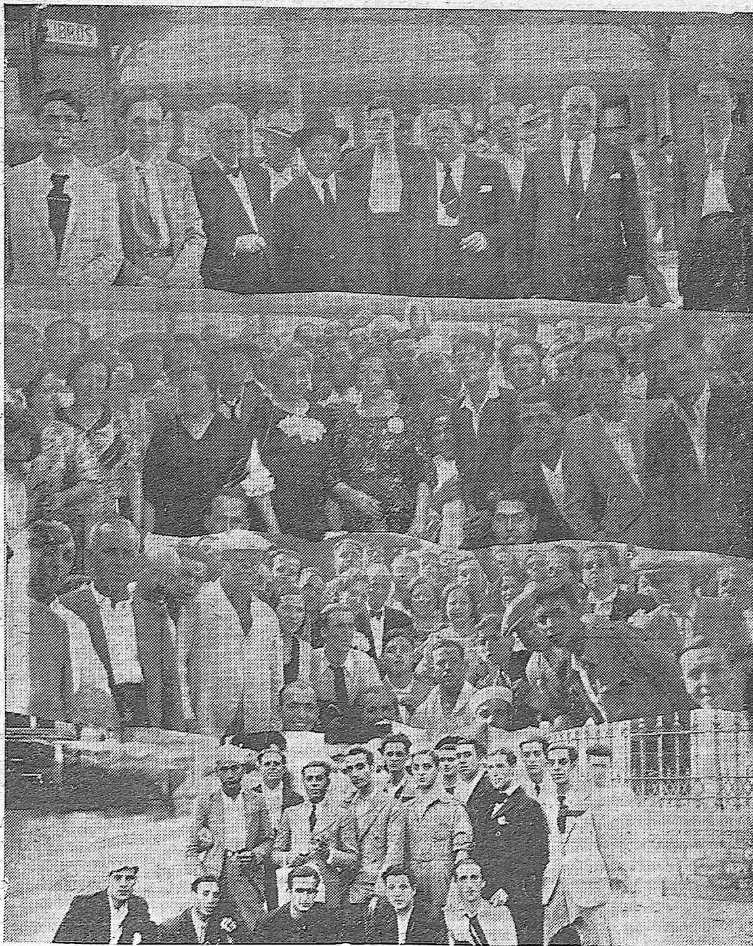
LA EXCURSION A ALGECIRAS, GIBRALTAR Y LA LINEA.—Autoridades de Algeciras con los periodistas cordobeses, Presidente de la Comisión de Festejos y Comisión Organizadora a la llegada de los excursionistas. — Varios grupos de excursionistas.