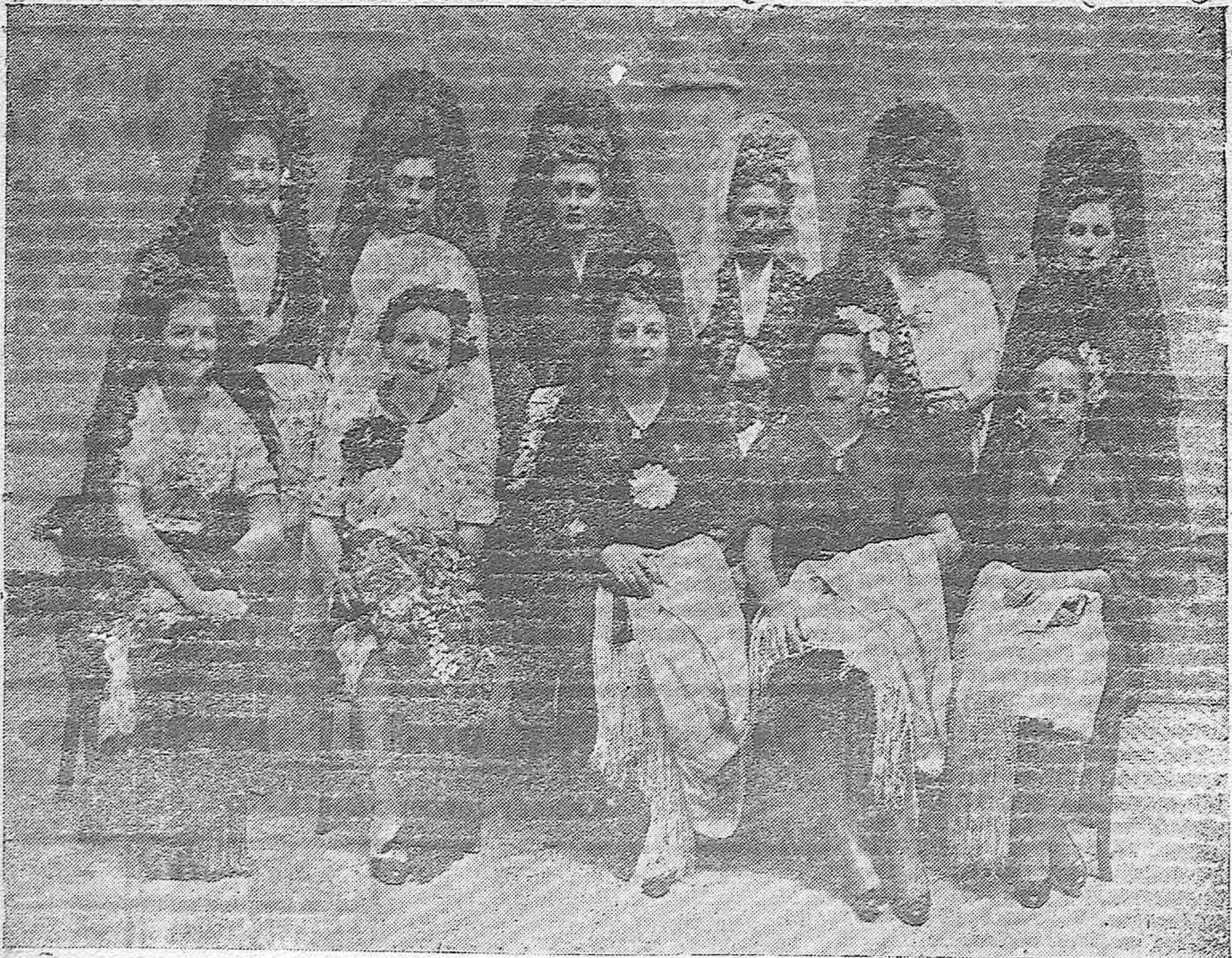
Las bellísimas camaradas que presidieron la Corrida a beneficio de "Asistencia a Frentes y Hospitales" el Día de la Raza, en Córdoba