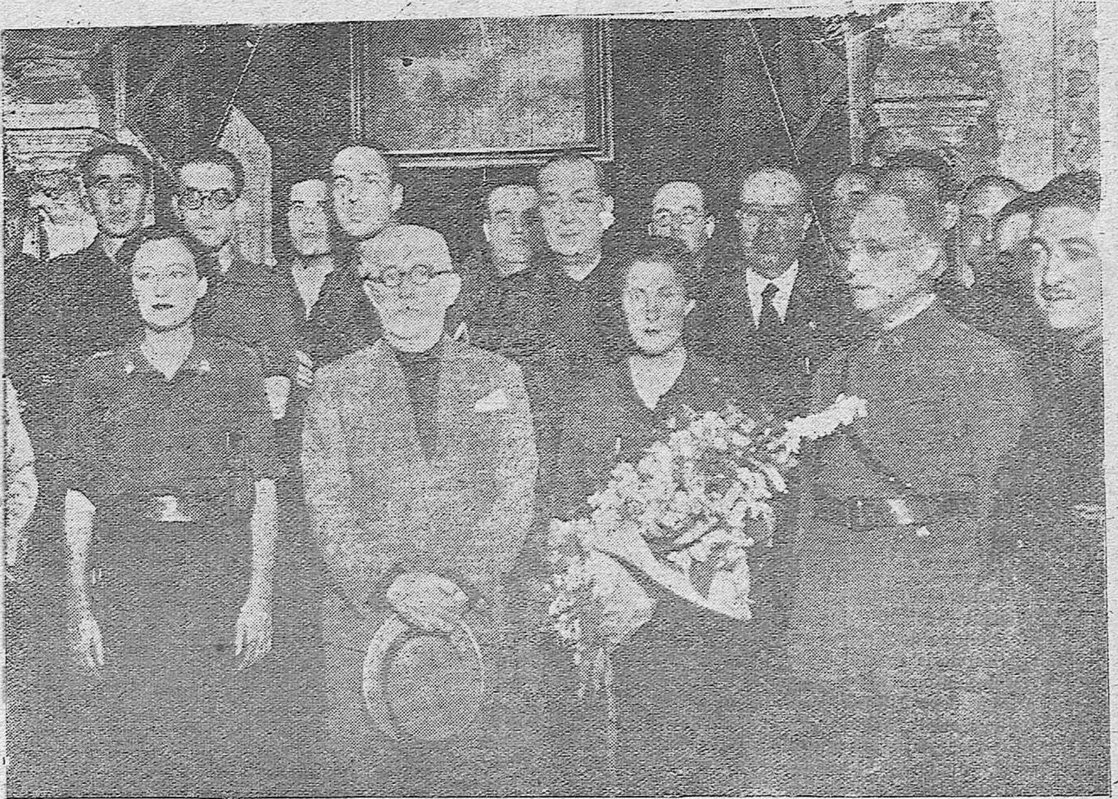
La recepción en el Ayuntamiento.-Pilar Primo de Rivera acompañada de las autoridades y mandos de Falange.