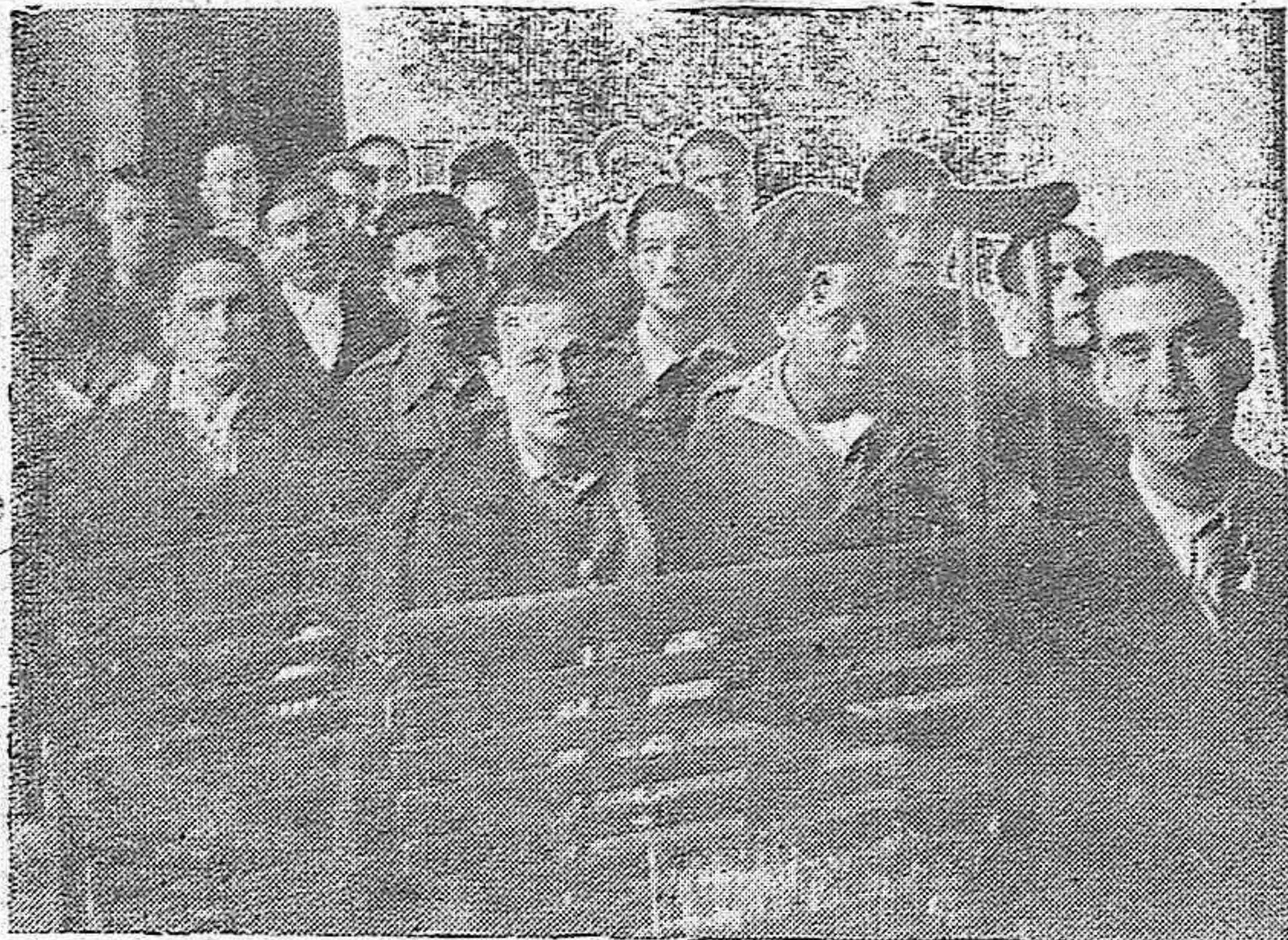
Grupo de Alumnos Mutilados que asistirán a la Academia inaugurada en Córdoba.