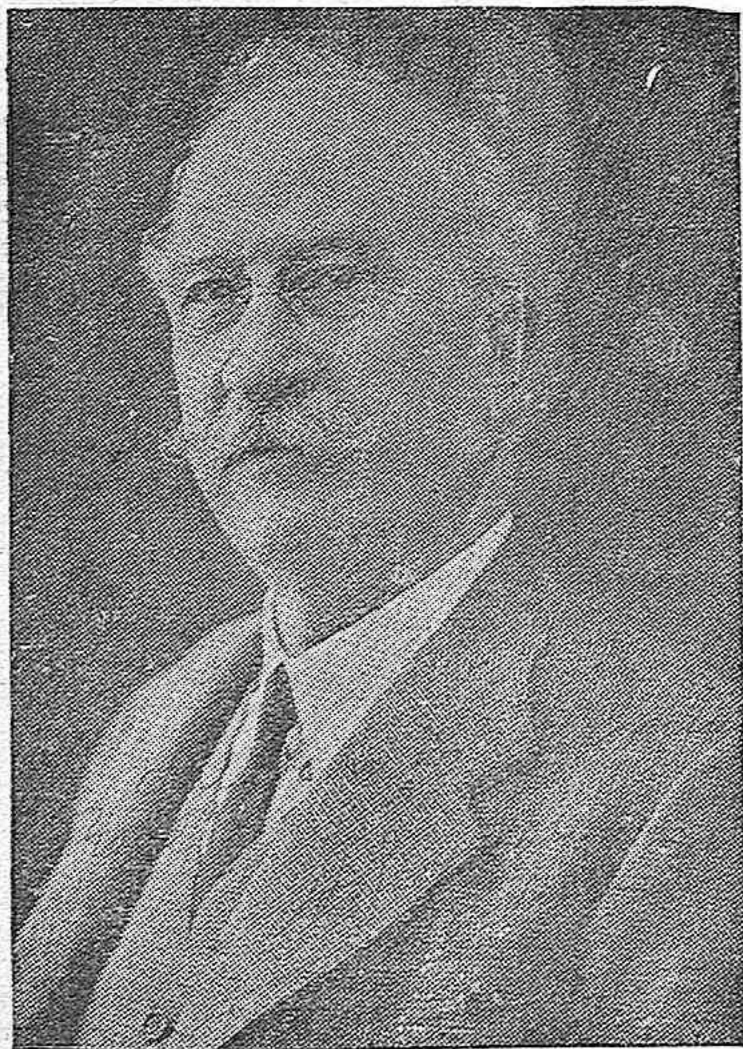
Lerroux, el gran patriota.

Acababa Lerroux de saber por el general Batet que el Gobierno de la Generalidad traicionando sus deberes, había proclamado la República Catalana. Había sostenido con el general jefe de las tropas españolas en