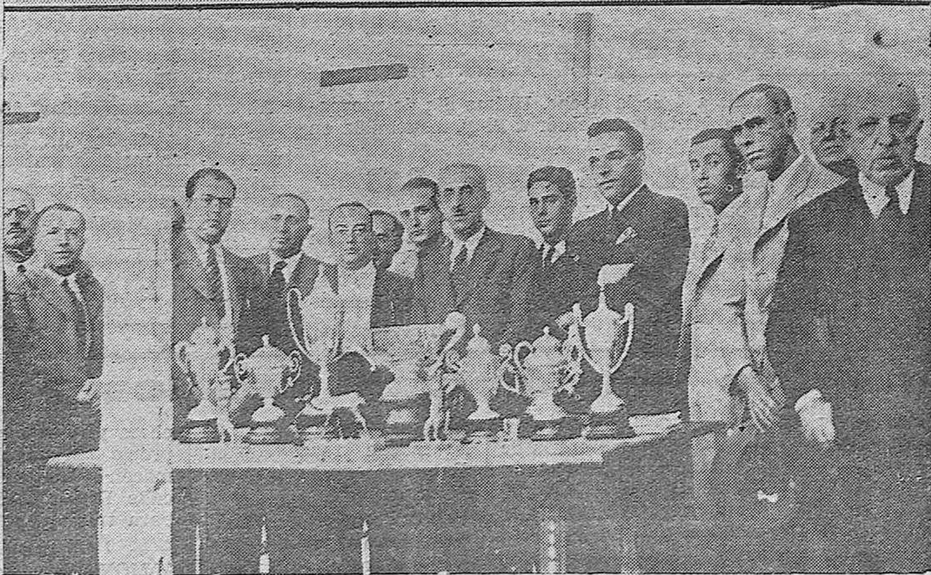
Arriba: Las autoridades, Comisión de concejales del Ayuntamiento y Junta directiva del Centro Republicano Radical, depositando coronas en el Monumento levantado a la memoria de la Batalla de Alcolea.—Abajo: Las autoridades provinciales y locales en Fuente Obejuna, durante el reparto de premios en el Concurso Comarcal de Ganados.