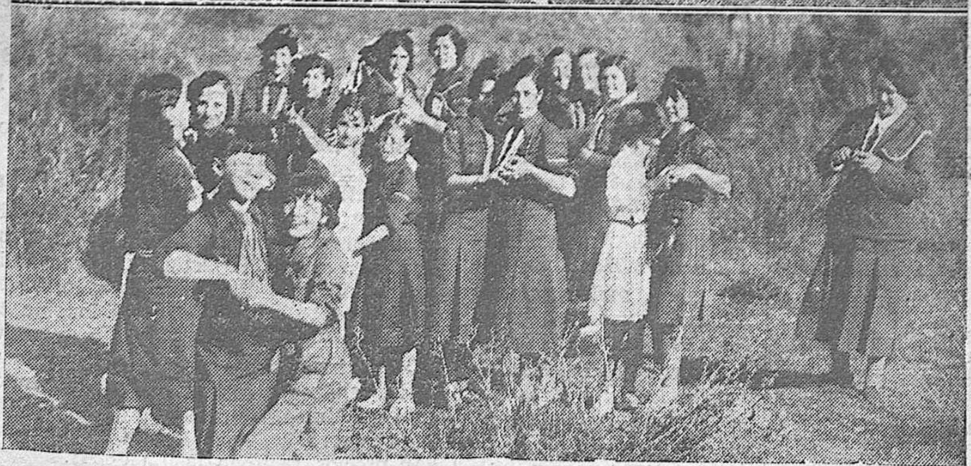
Varios grupos de las Muchachas Guías en su campamento del "Pocito de Cabriñana", donde asisten los domingos para celebrar diversos ejercicios.