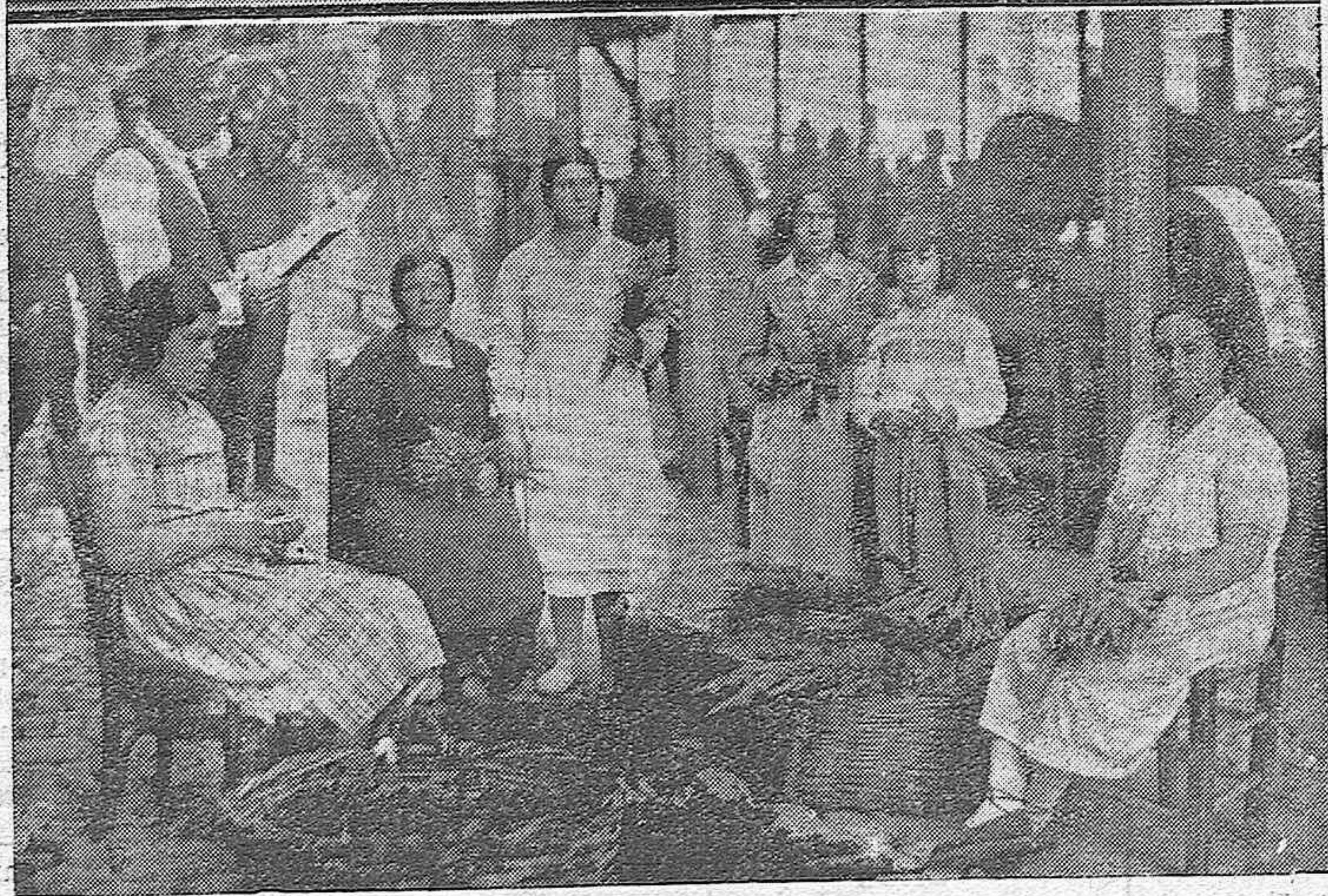
LOS PREPARATIVOS DE LA FERIA DE LA SALUD.—Bellas jóvenes trabajan con actividad y entusiasmo en el adorno de las carrozas que han de figurar en la Batalla de Flores, uno de los festejos más sugestivos de la Feria