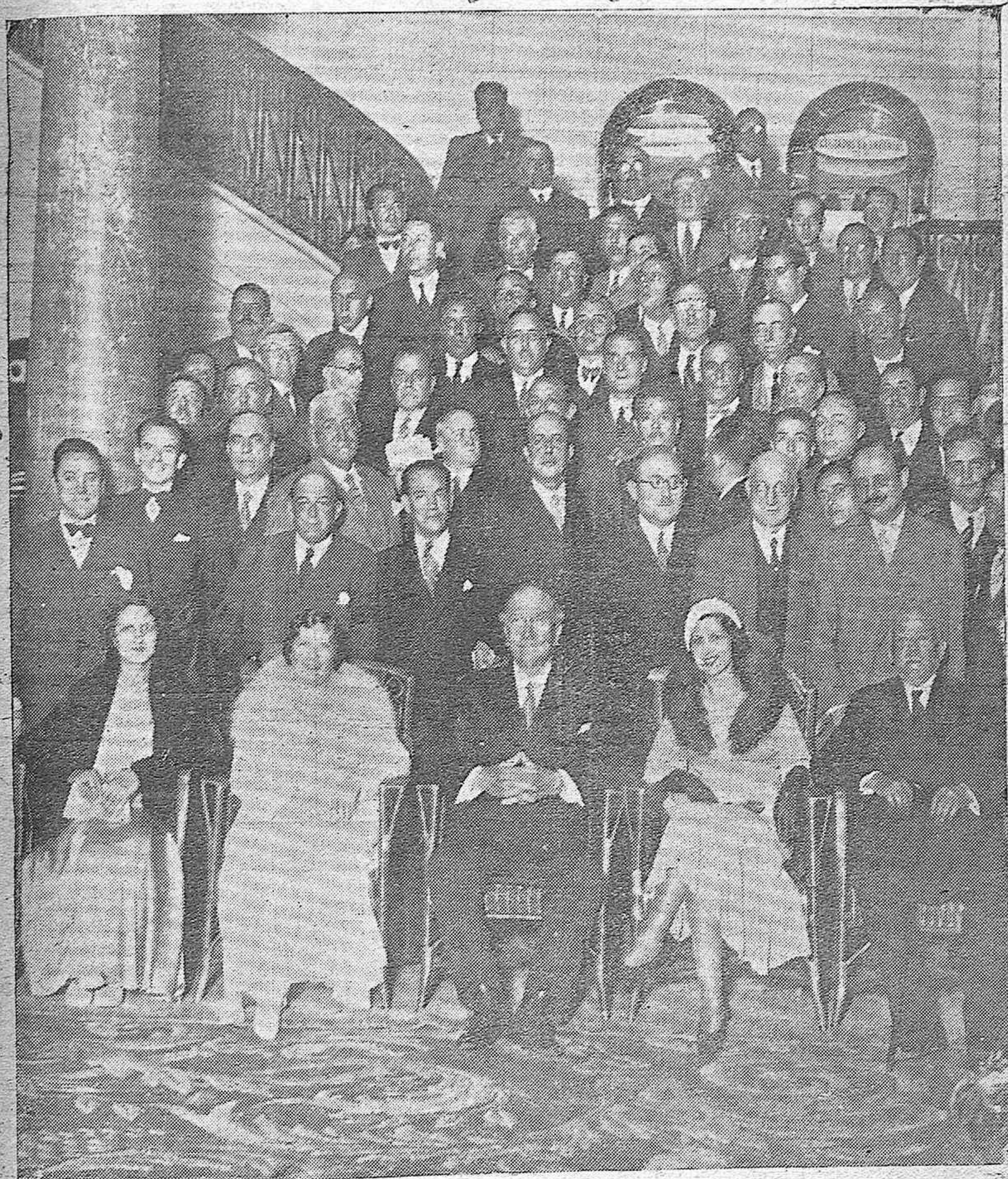
ACTUALIDAD GRAFICA MADRILEÑA.—El ilustre jefe del partido radical, don Alejandro Lerroux, a la terminación del banquete celebrado en el Hotel Nacional, con que le obsequiaron los delegados de provincias que han asistido a la reciente Asamblea del Partido.