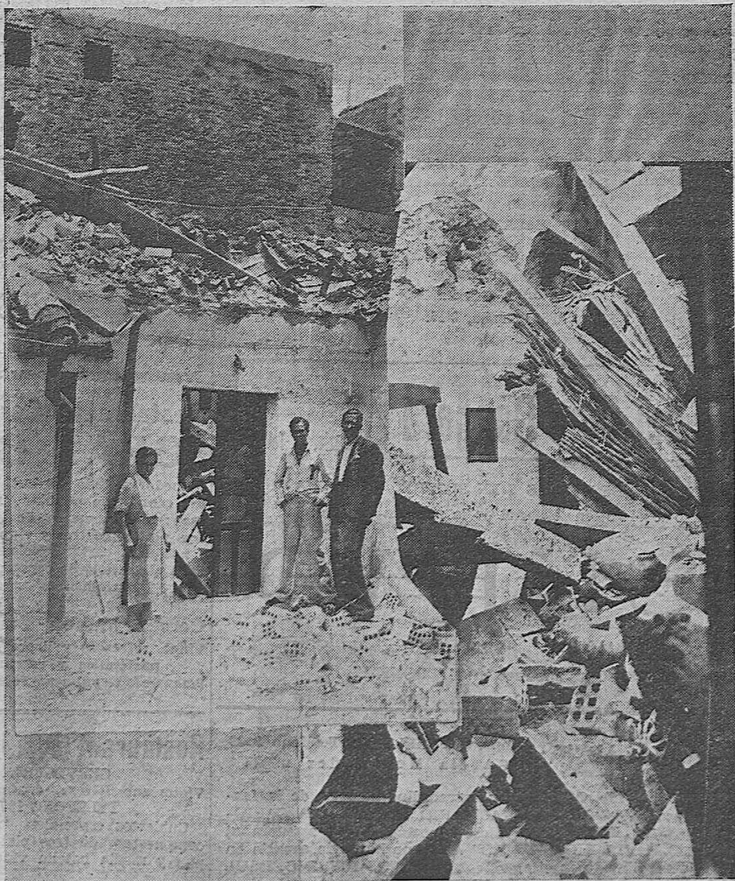
Dos vistas del derrumbamiento de la casa de la calle de los Cidros.