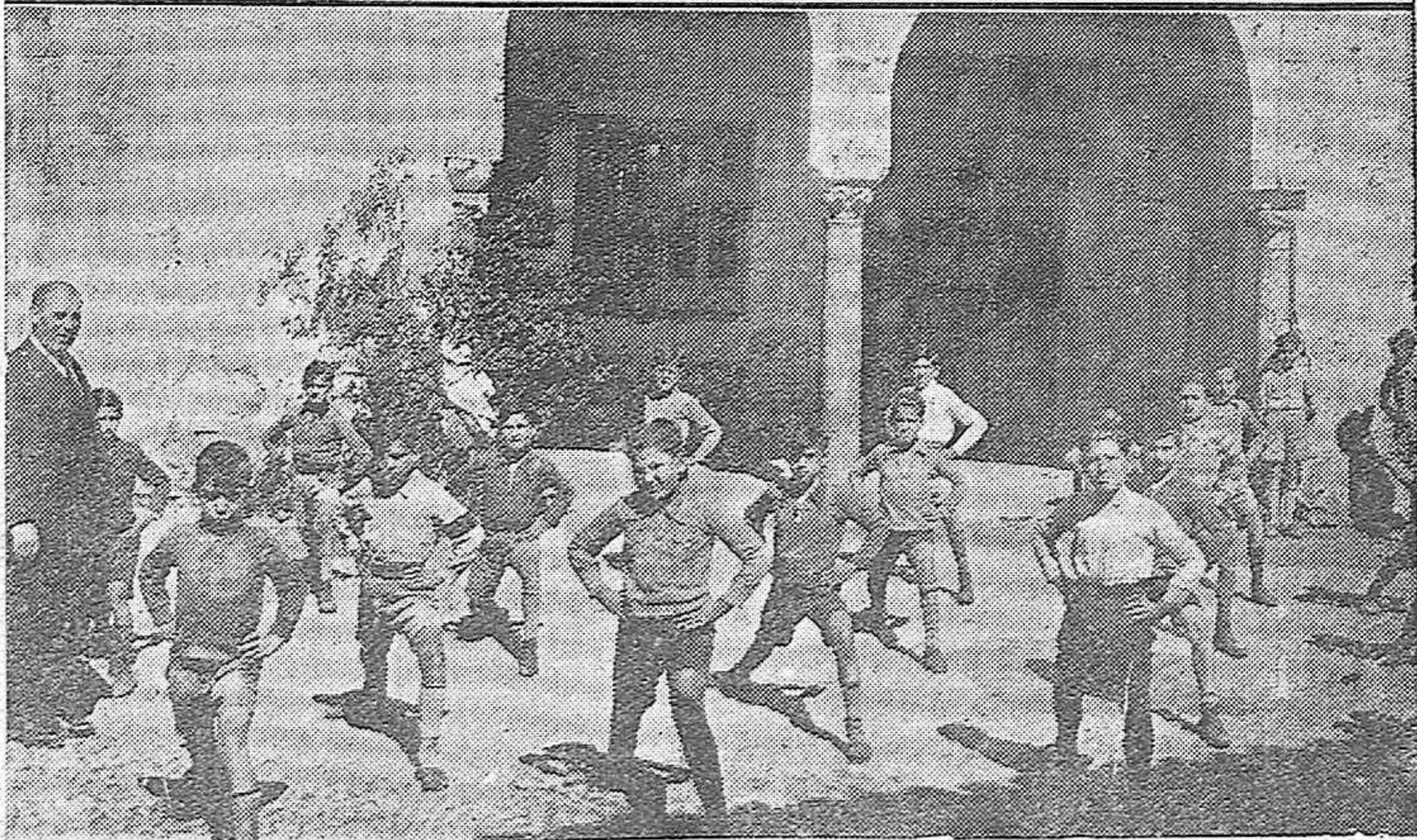
Arriba: Alumnos del Grupo Escolar Alcántara.—Abajo: Una de las Secciones de dicho grupo durante la gimnasia.