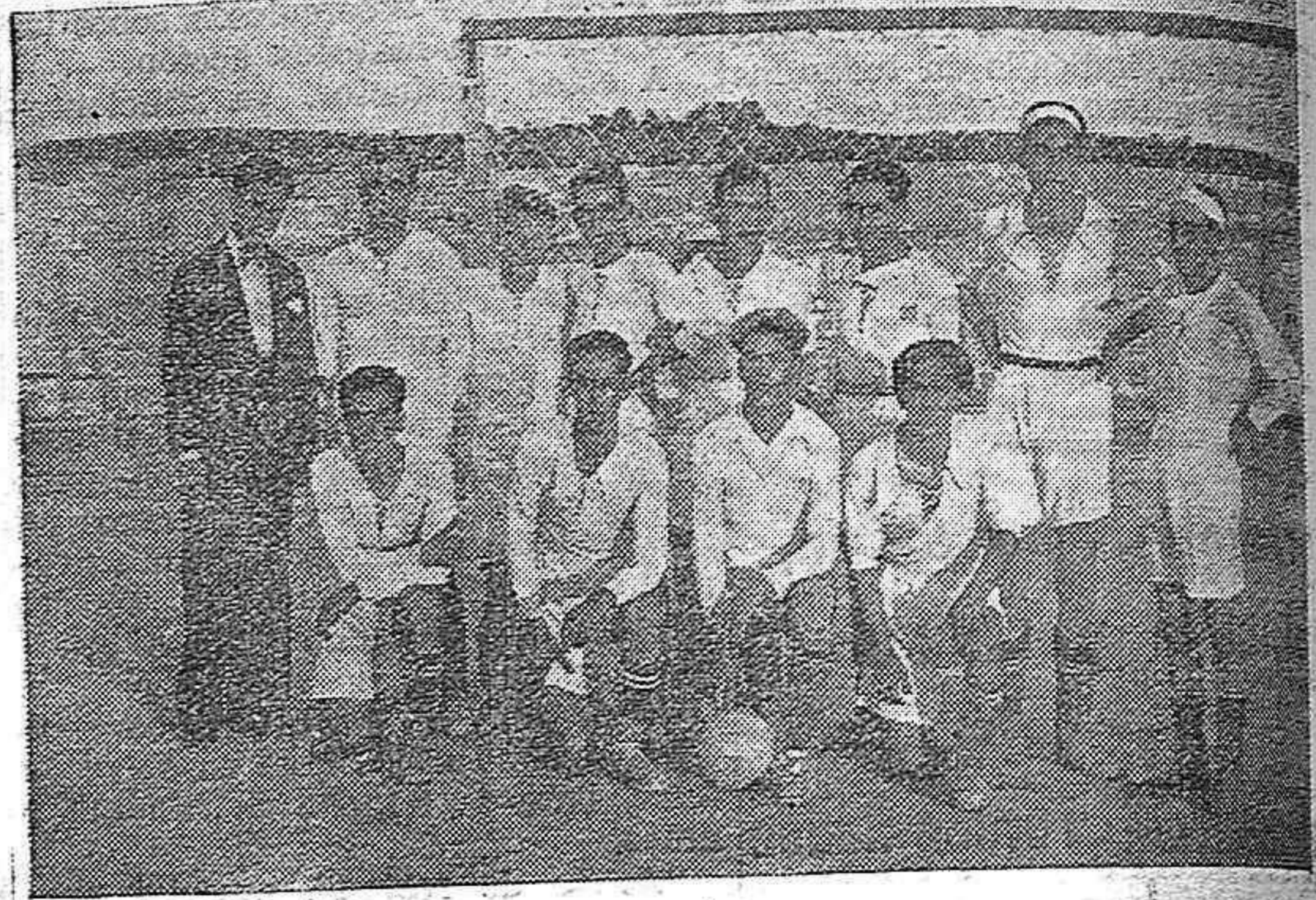
El Club Deportivo Andaluz, que tantos láuros alcanzó para su patria chica