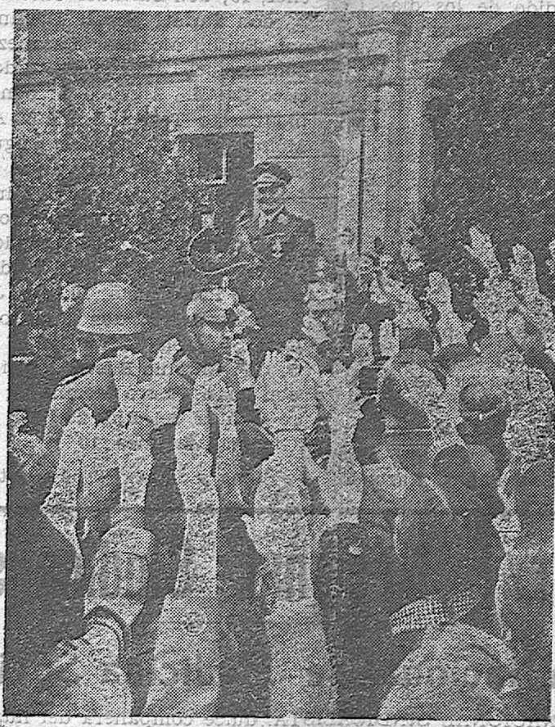
HE AQUÍ UN GOLPE DE VISTA DE LOS OYENTES DURANTE EL DISCURSO DEL MARISCAL, QUE PRONUNCIÓ EN WELLS Y QUE FUE INTERRUMPIDO CONTINUAMENTE POR APLAUSOS FRENETICOS.