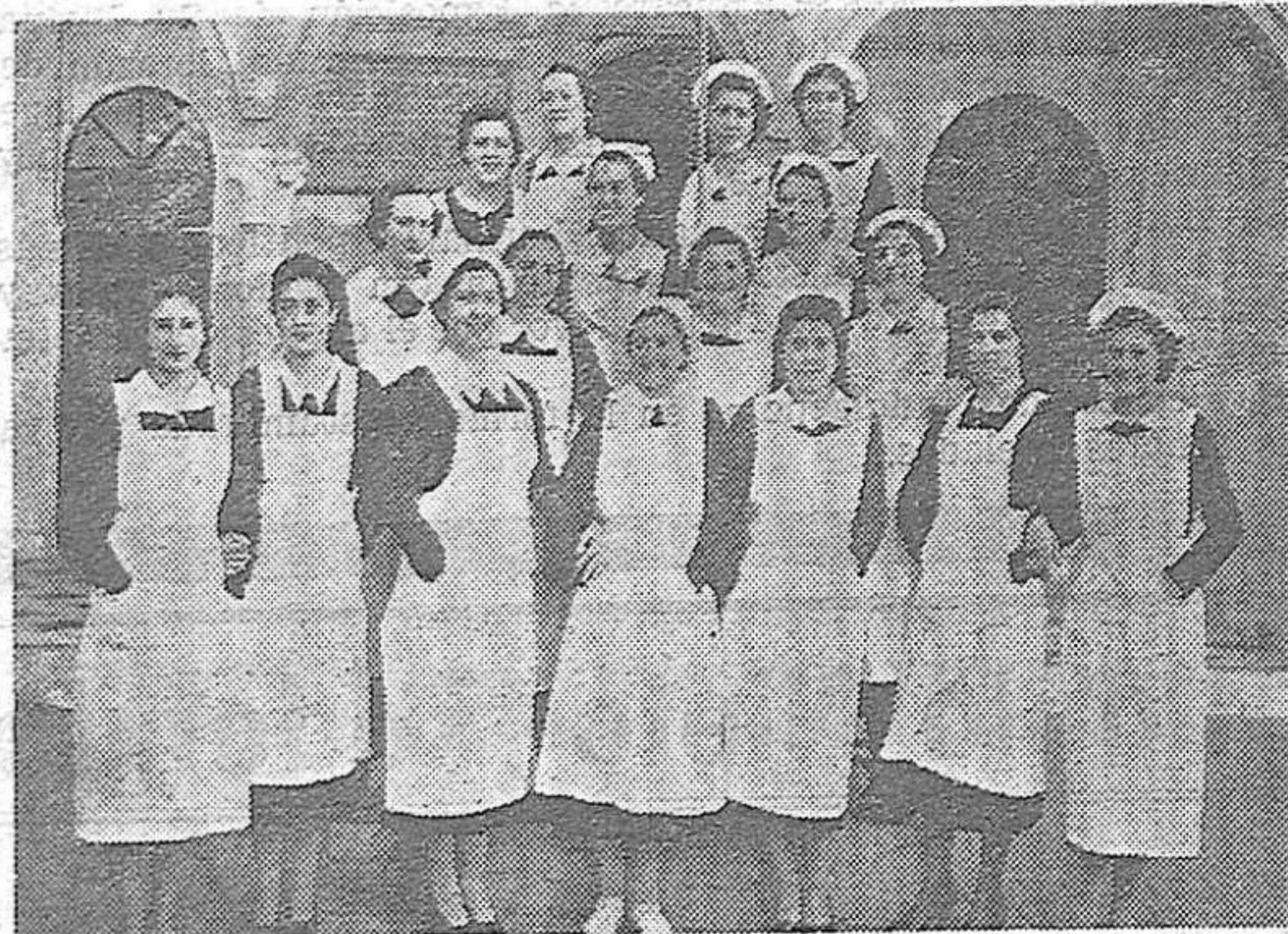
Un grupo de enfermeras del Ofanatorio Provincial de San Gonzalo, cuya generosa actuación en favor de los niños desvalidos ha merecido los mayores elogios.

en la Sub-Delegación del Estado para Prensa y Propaganda, edificio de Radio Córdoba.