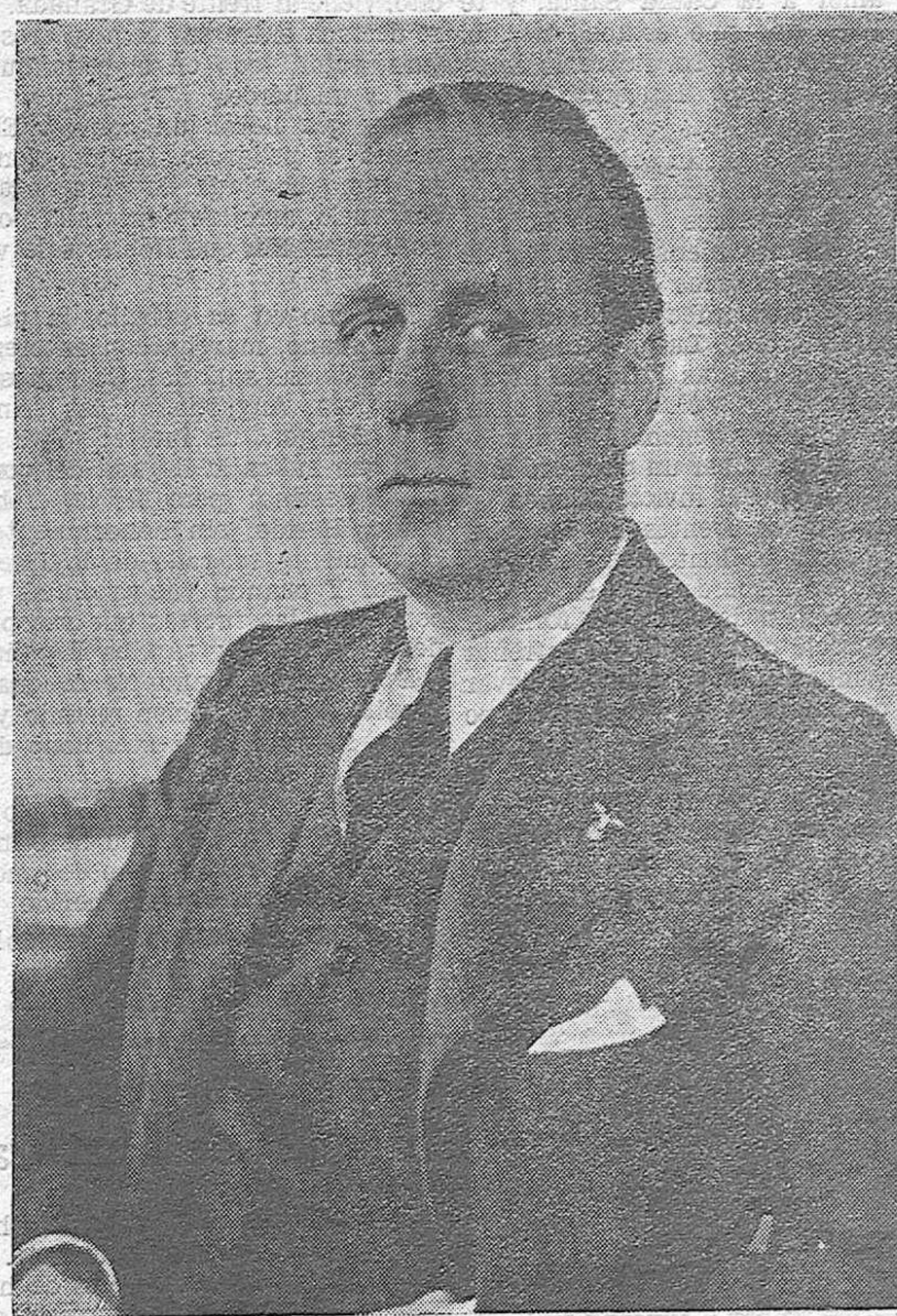
Botschaffer Joachim Von Ribbentrop es el diplomático alemán que hoy realiza una de las misiones más difíciles que pueden encomendarse a un representante de nación. La mirada del mundo está fija en von Ribbentrop, y éste, entre Londres y Berlín, labra sin descanso.

Esta clarividencia normativa de nuestro Caudillo debe ser un motivo de satisfacción plena. Así será posible—y, de aquí a poco cierta—, la reconstrucción de esta España ya cauterizada y sublimada por sus muertos y heridos.