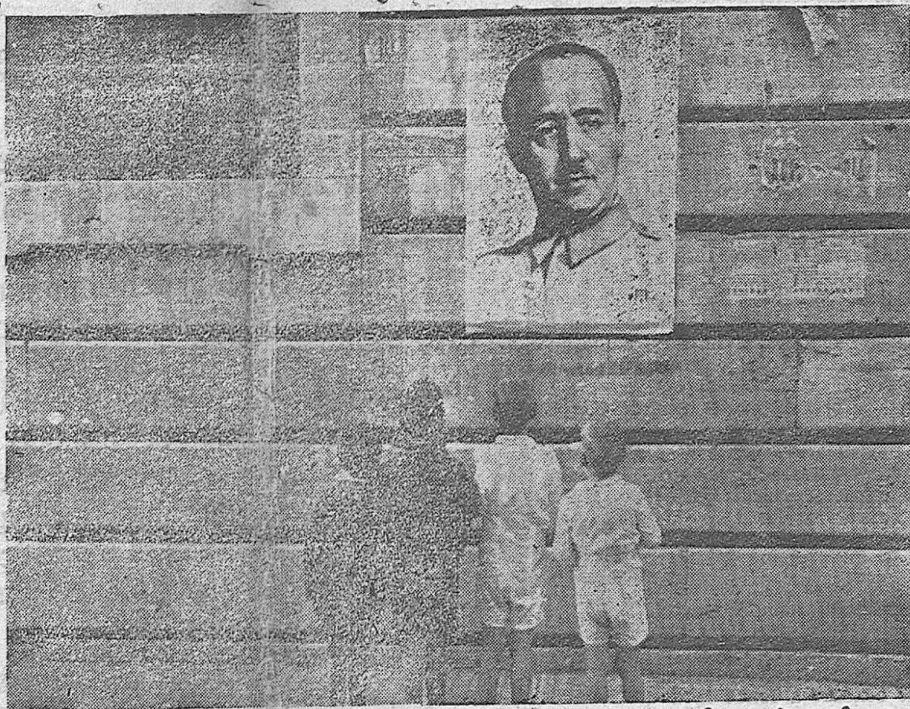
Los niños de España se agitan ante el retrato del Caudillo, contemplándole con afecto y emoción. Ahora, después de la epopeya de Teruel, el genio militar del Generalísimo aparece de nuevo en su máxima brillantez. Y de todos los labios surge este grito: ¡FRANCO, FRANCO, FRANCO! ¡ARRIBA ESPAÑA!