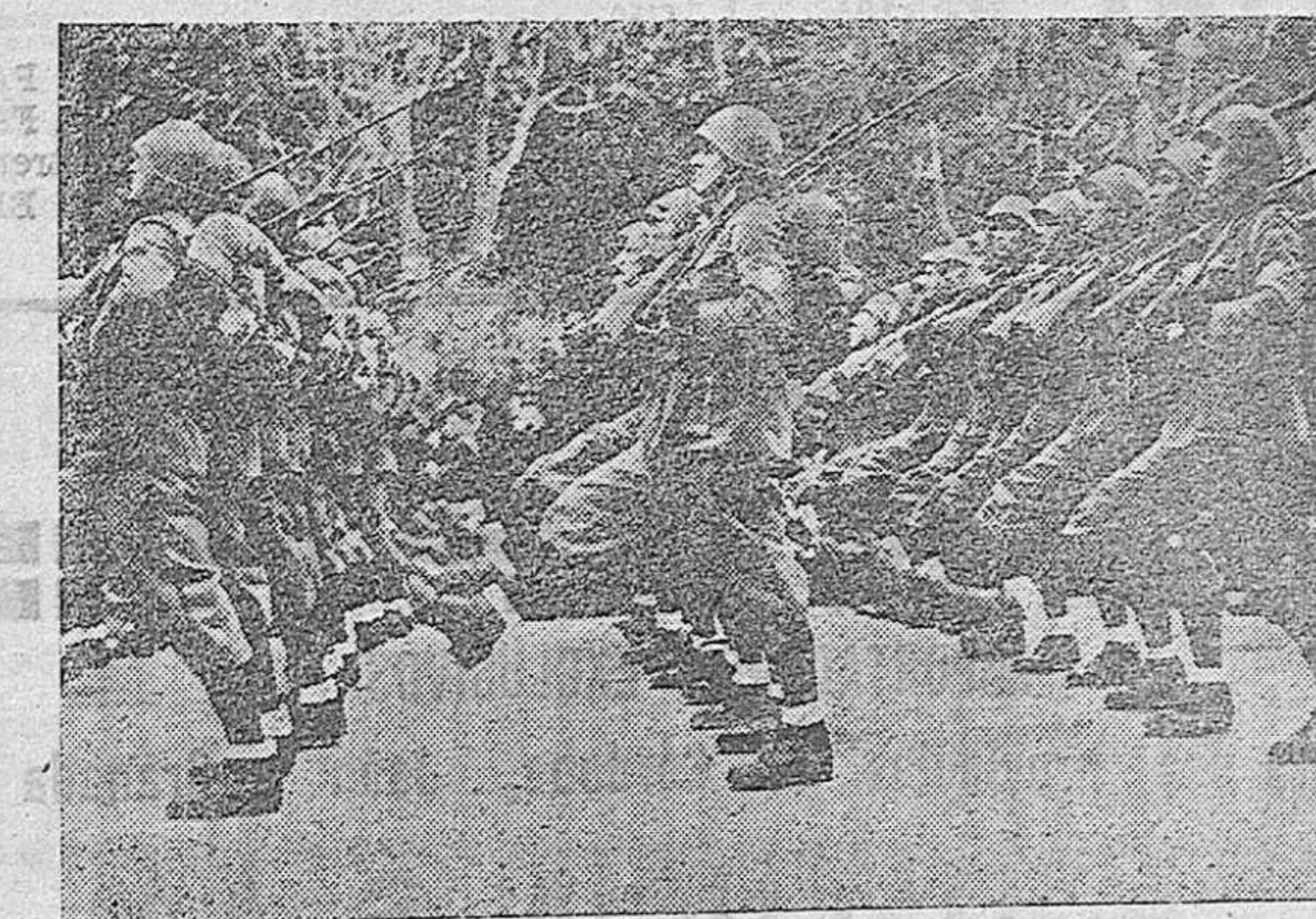
Batallones de Camisas Negras, desfilando al "paso romano" de parada.