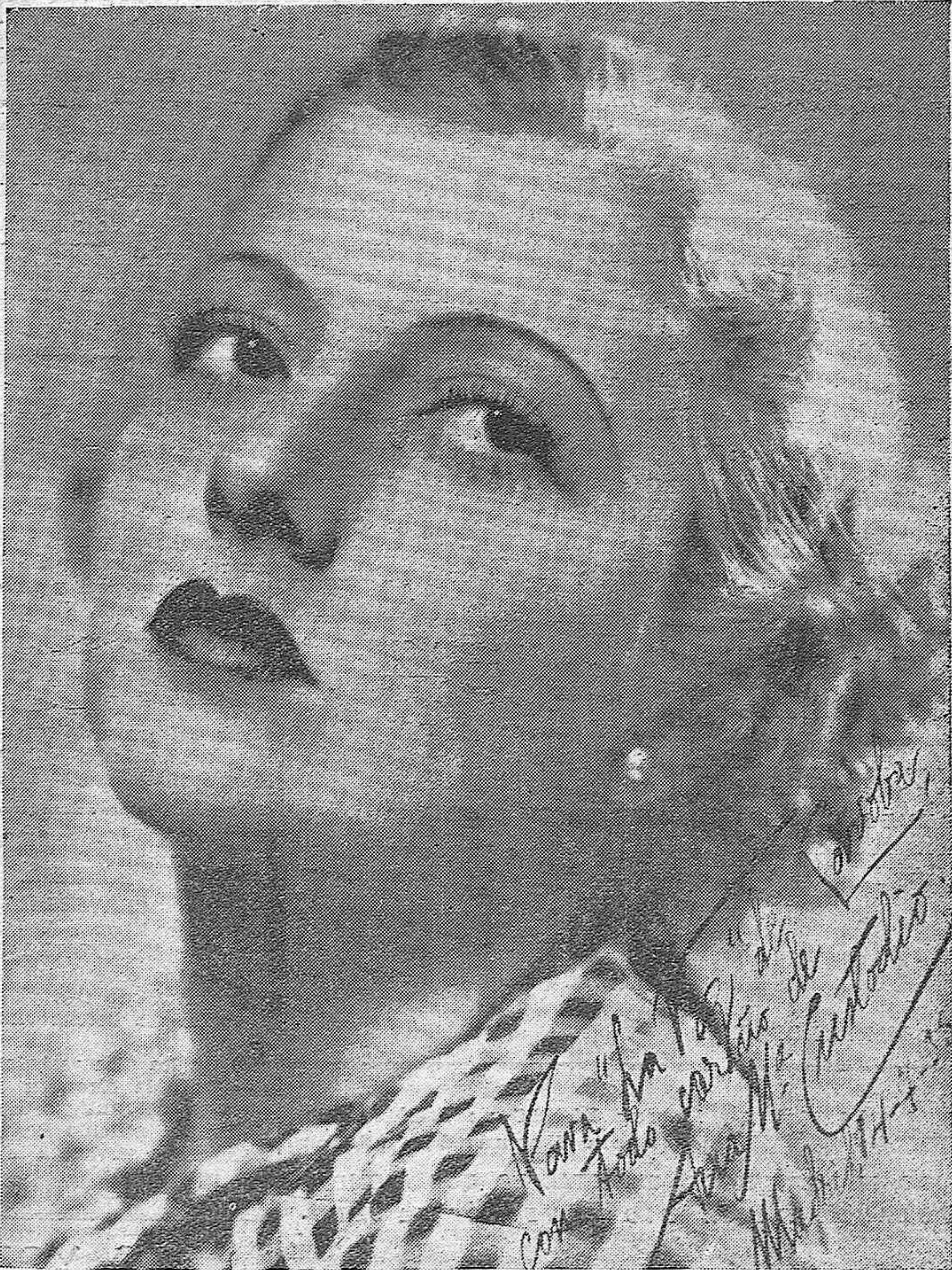
ANA MARIA CUSTODIO, la bellisima estrella de "Filmófono", protagonista de "Don Quintín el Ariargao" el film cuyo estreno ha de constituir un éxito, nos honra con esta foto dedicada a LA VOZ que agradecemos profundamente