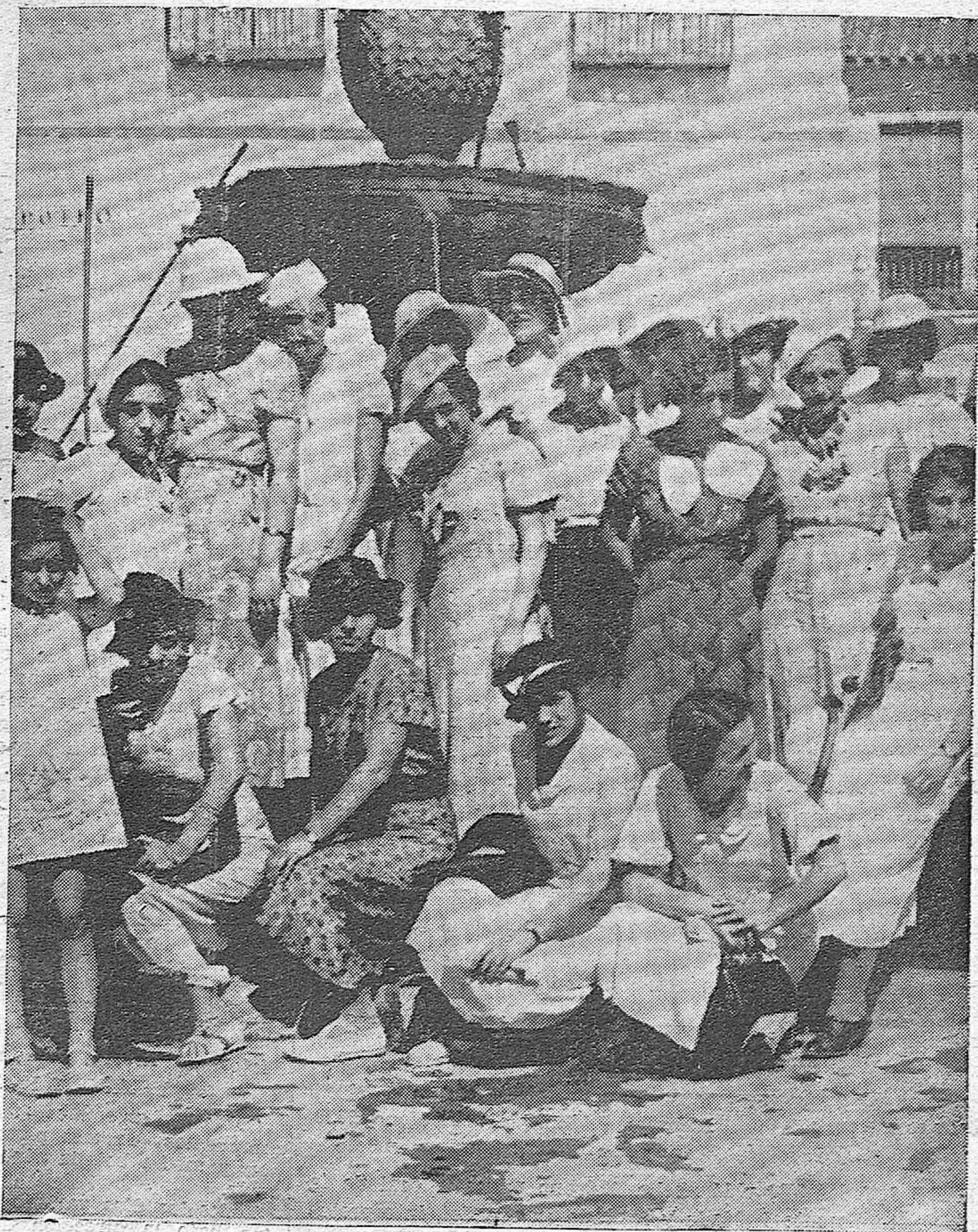
Profesoras francesas que visitaron ayer nuestra capital en viaje de estudios.