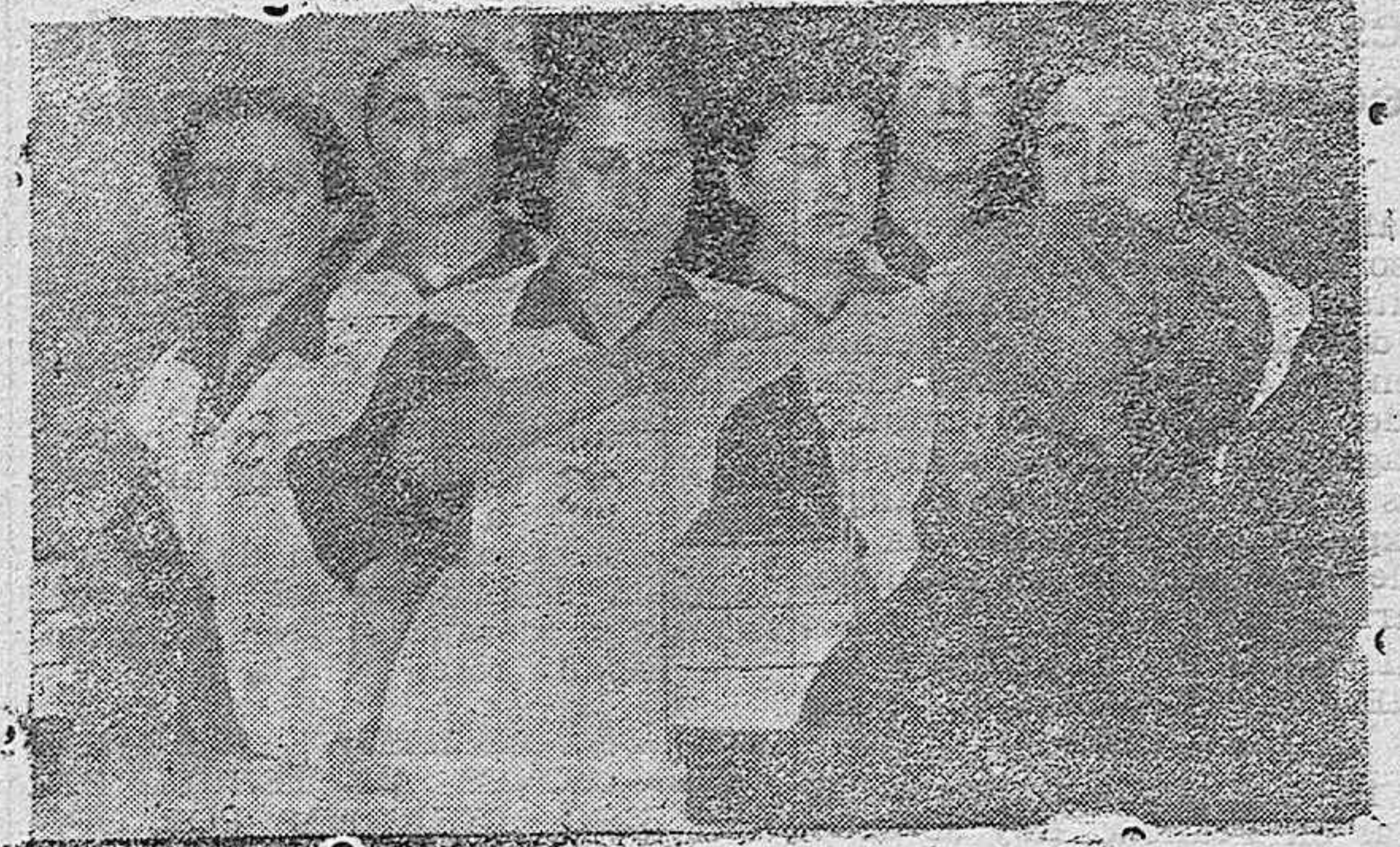
LA RAMBLA.-E! “Día de la Falange” las camaradas de “Auxilio Social” sirvieron la comida a los ancianos en la Cocina de Hermandad inaugurada.

De conformidad con lo preceptuado en la Circular de 11 de Diciembre de 1928 y en su relación con la 20 de Diciembre de 1927 en su párrafo primero, ambas de la Dirección General de Rentas Públicas, esta Administración de Rentas Públicas, requiere a todos los contribuyentes obligados a llevar el Libro de Ventas u Operaciones, para que dentro del actual mes de Enero presenten los de la capital en la Administración de Rentas de esta Delegación y en la Alcaldía respectiva, los de los pueblos, una declaración jurada del importe de las ventas u operaciones realizadas en sus negocios industriales y mercantiles, en vista de los datos que arroje sus respectivos libros en 31 de Diciembre. En la inteligencia, de que los contribuyentes sujetos a la mencionada obligación que de jeren incumplida o no presentasen sus respectivas declaraciones en el plazo marcado, quedarán incurso en la multa de 25 a 500 pesetas, sin perjuicio de exigir la responsabilidad que proceda. Quedan exceptuados de tales obligaciones, entre otros, los contribuyentes que a virtud del D. de 30 de Abril de 1932 estén sujetos a la Contribución sobre Utilidades de la riqueza Mobiliaria (Efigrafo C) número segundo de su Tarifa 11. Córdoba 10 de Enero de 1938.—Segundo Año Triunfal.—El Administrador de Rentas Públicas, P. S. JOAQUIN FERNANDEZ.