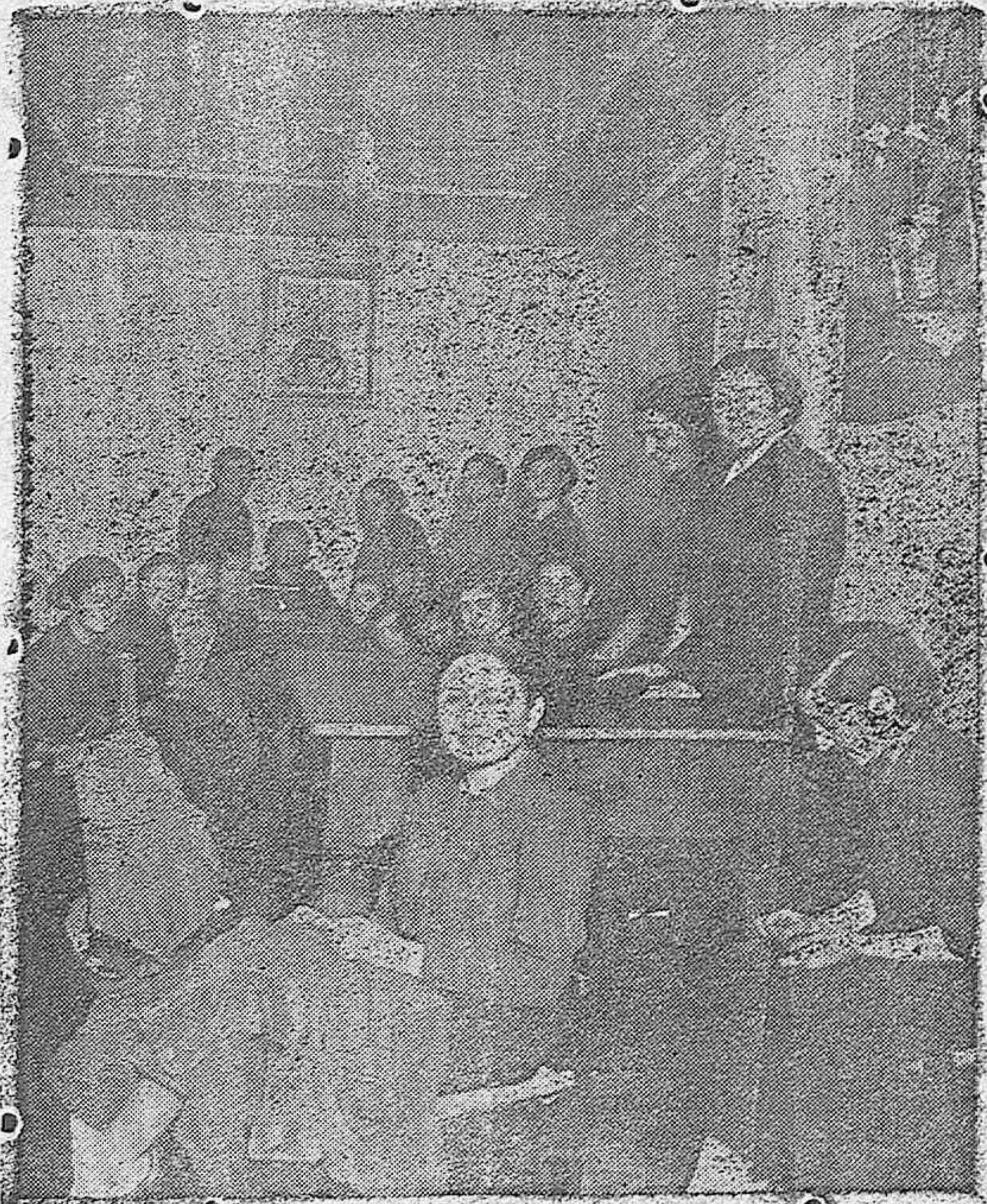
LUCENA-Taller de "Auxilio Social" donde las camaradas falangistas confeccionan ropa para el Glorioso Ejército español.