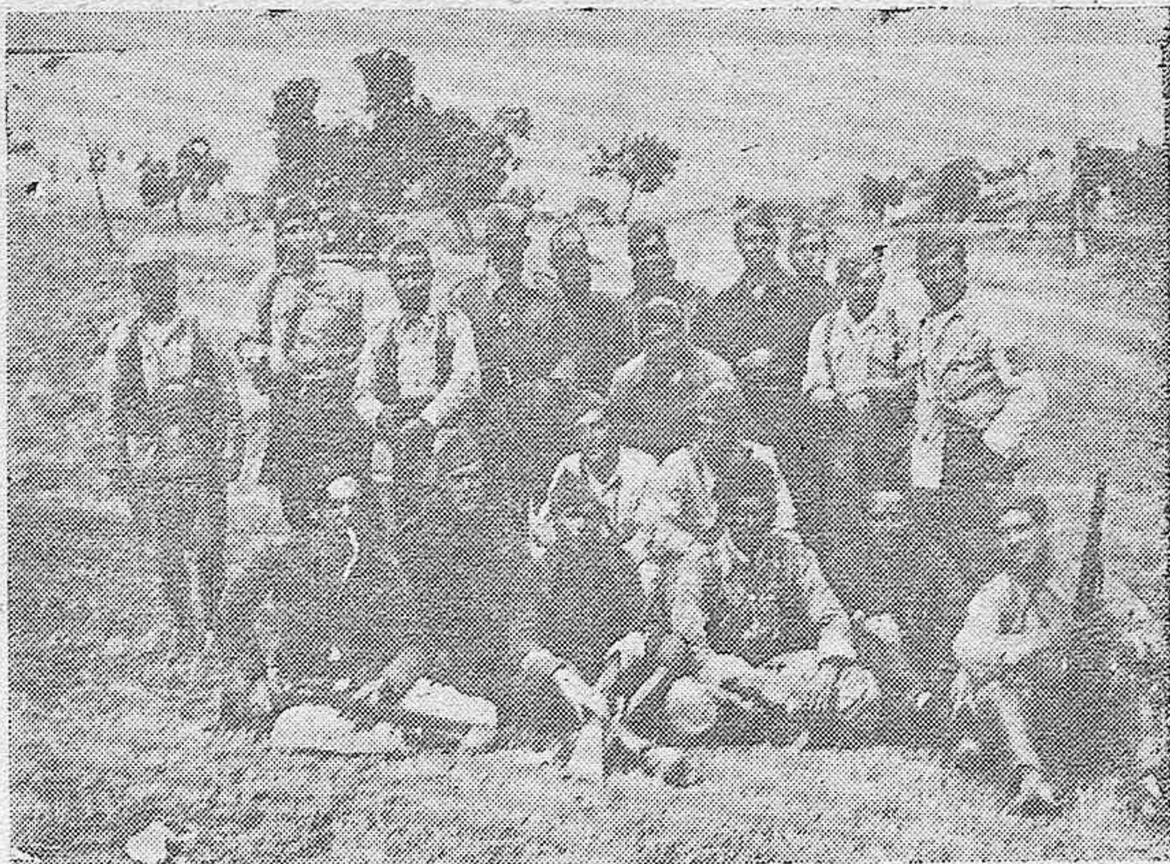
Grupo de heroicos nacionales en uno de los frentes de Córdoba