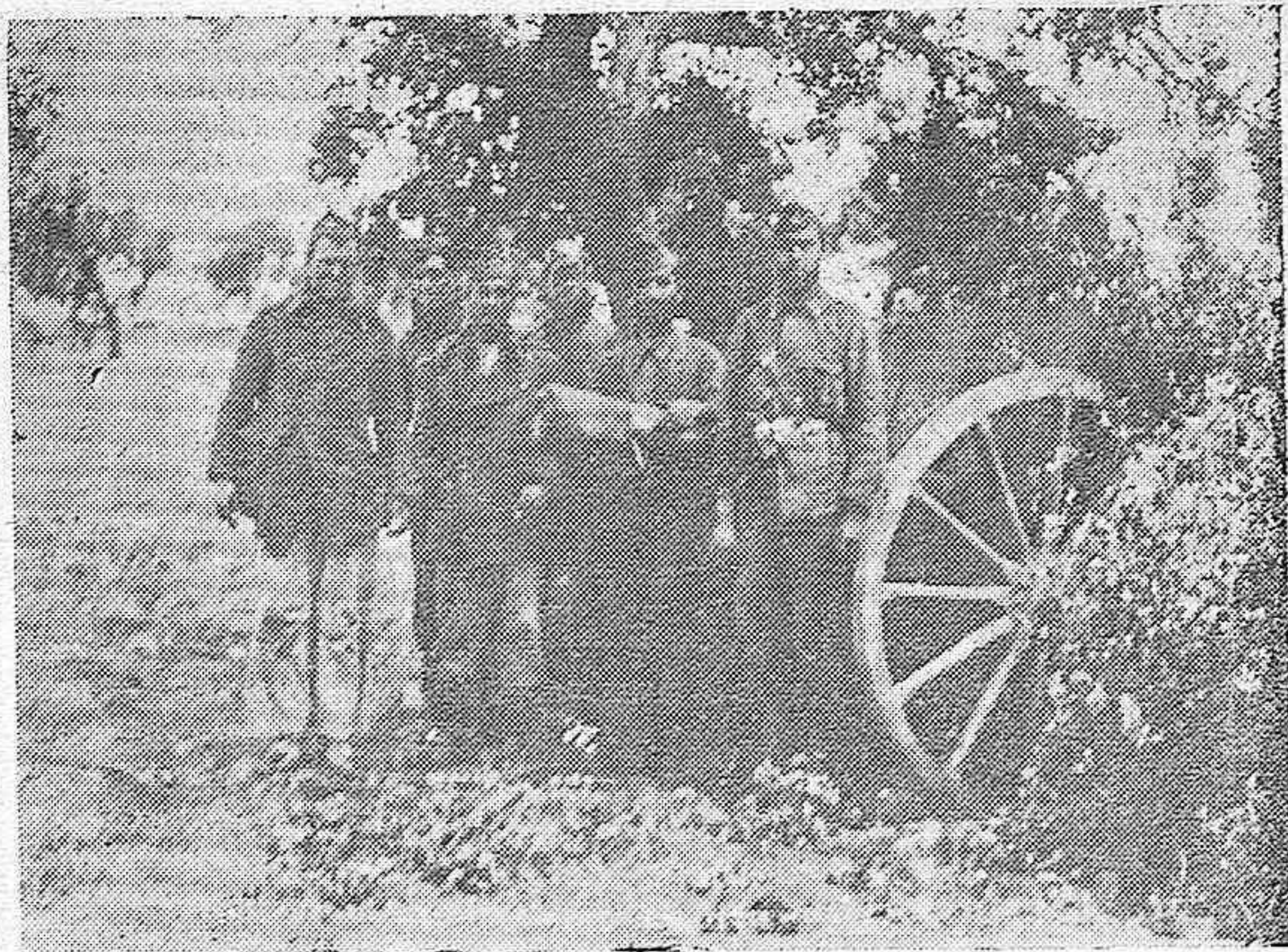
Detalle del frente cordobés. Los que arriesgan su vida por España