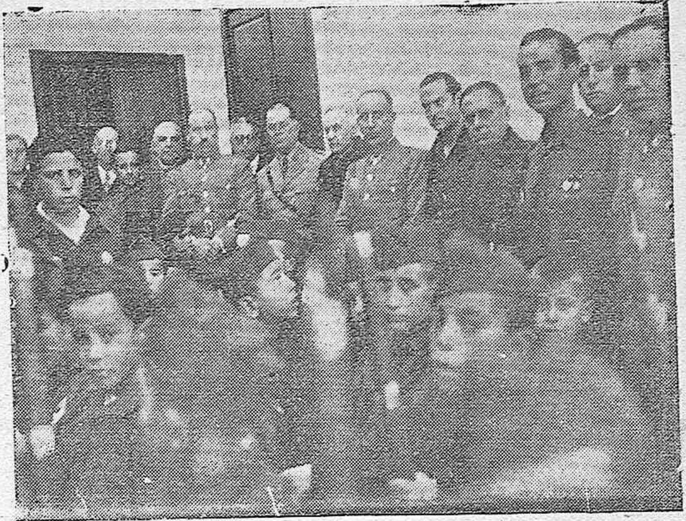
Las autoridades de Aguilar de la Frontera, en el acto de inaugurar el Cuartel de Falange.

Quedará expuesto durante diez y seis días en los plazos reglamentarios de a qho.