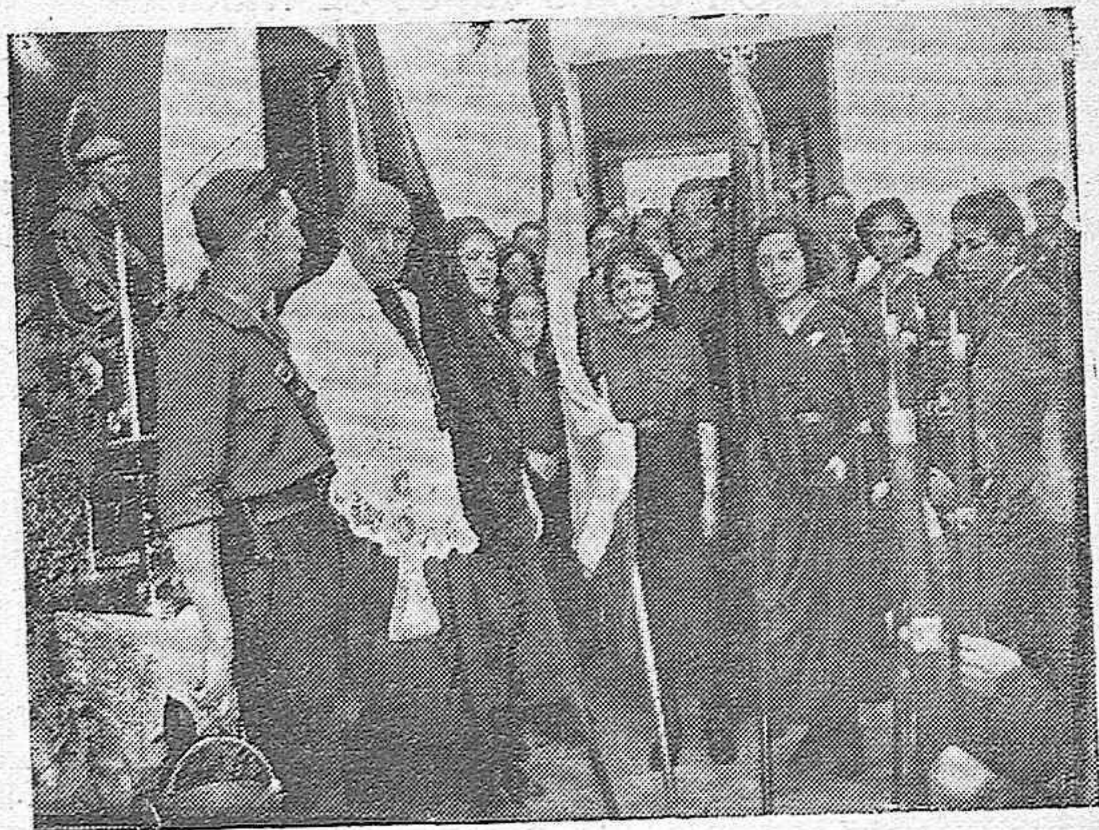
La bendición de las banderas de Falange en Aguilar de la Frontera.