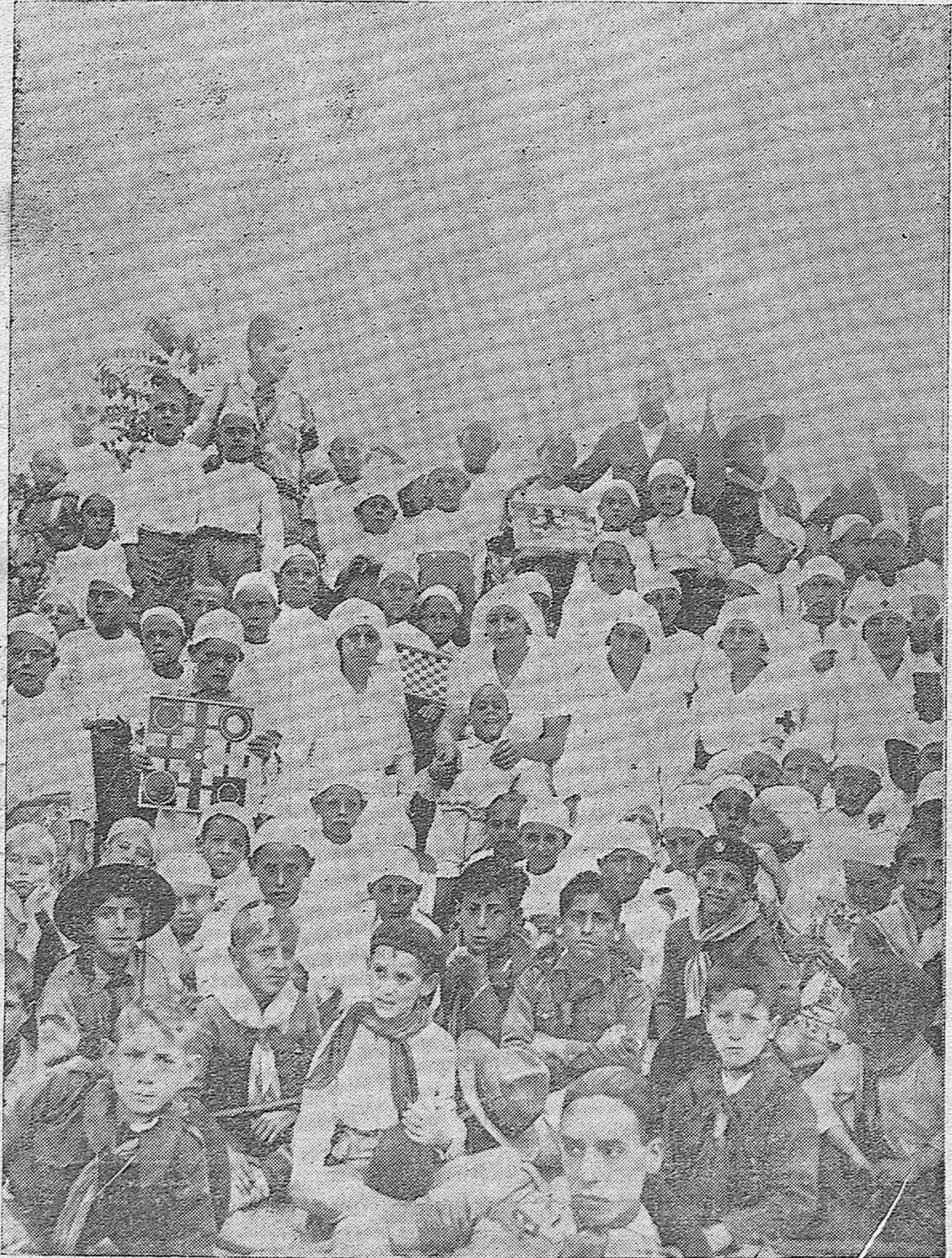
EN CERRO MURIANO.—Exploradores cordobeses entregando juguetes a los niños de las colonias escolares que están pasando un a temporada en aquellos hermosos y saludables parajes