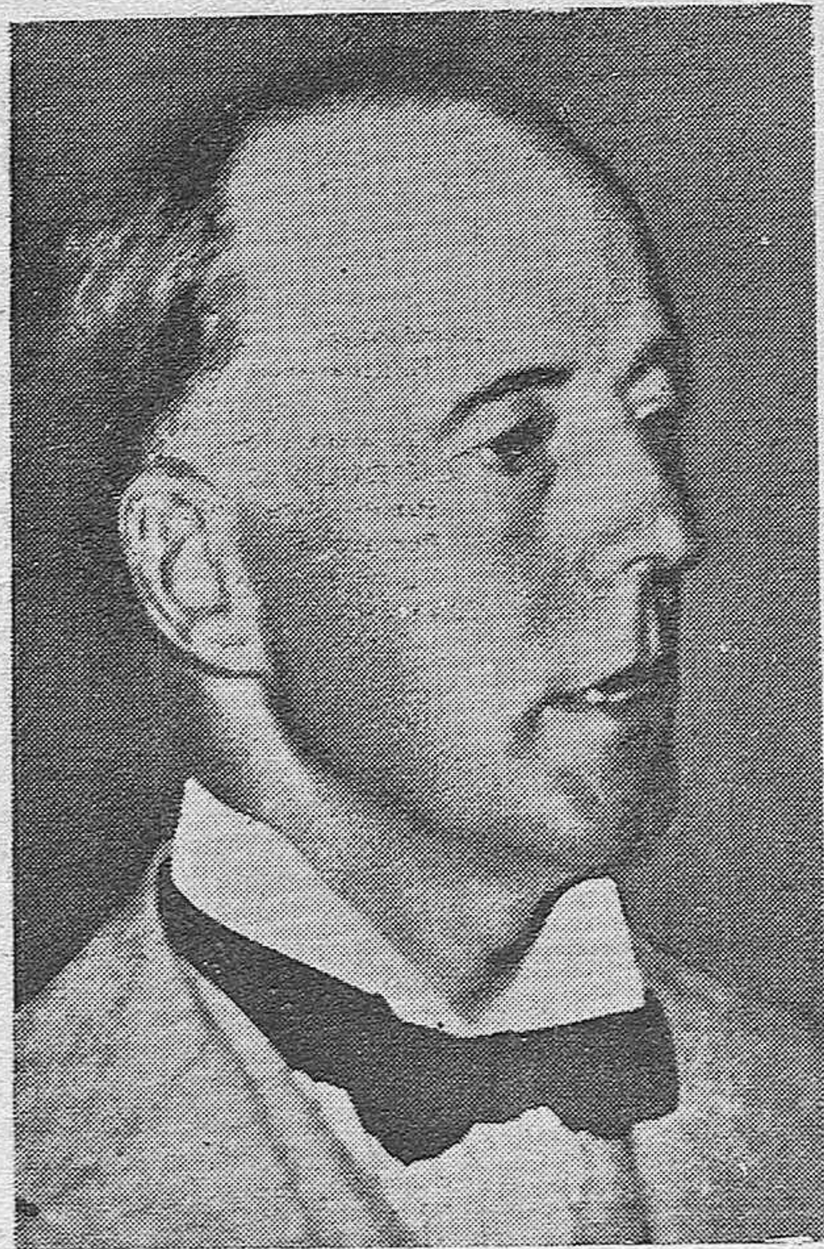
Lord Runciman, el hombre de confianza de los gobiernos inglés y francés que ac ualmente se encuentra en Praga, en concepto de consejero e intermedia io para la solución de las cuestiones políticas en Checoeslovaquia.

Se saca a concurso la construcción de un Comedor para los obreros de esta fábrica, de 900 metros cuadrados de superficie, con arreglo al plano y pliego de condiciones que obran a disposición de los interesados en estas Oficinas todos los días laborables de diez a 12.