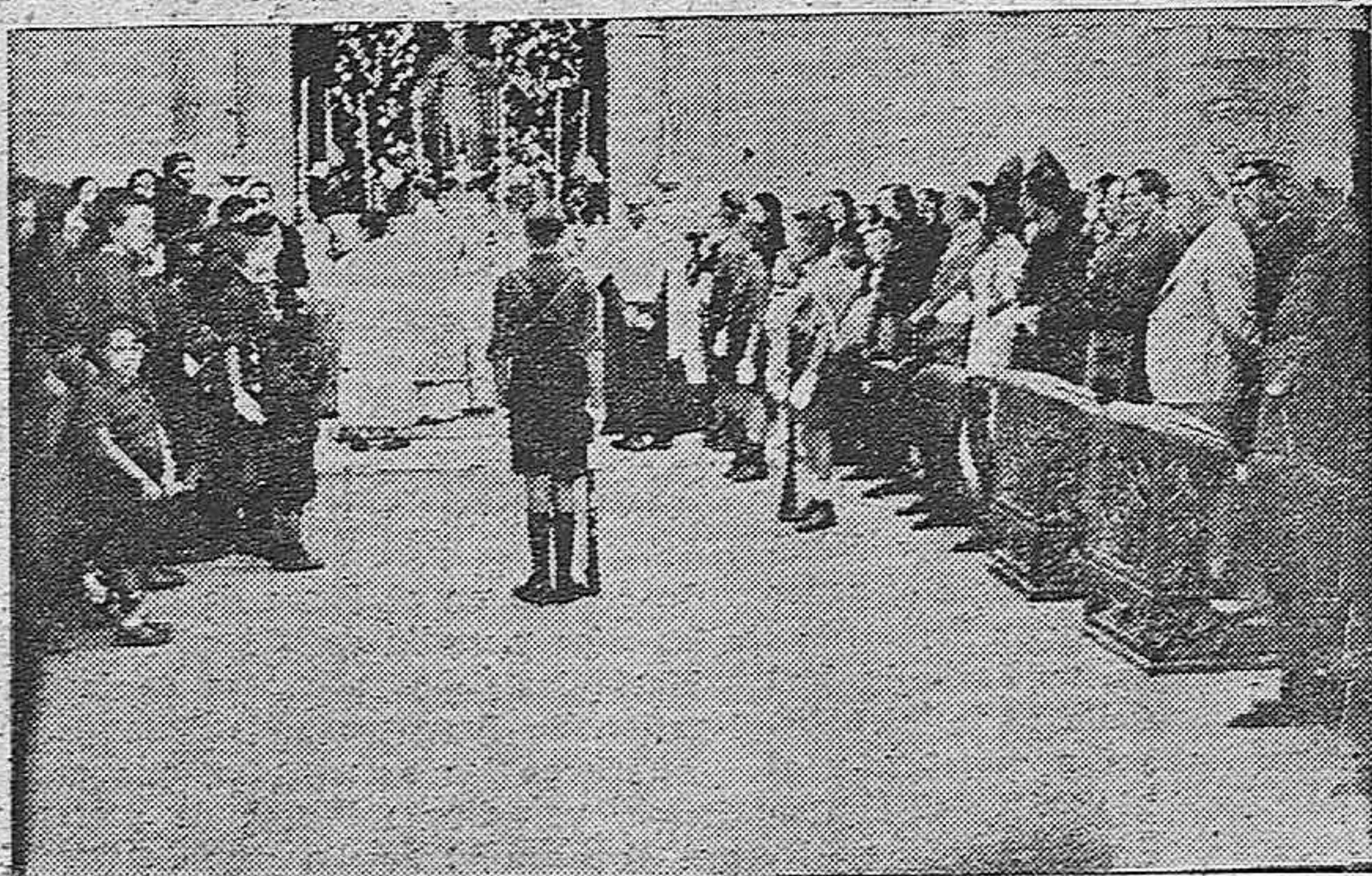
EL DIA DE LA FALANGE EN MONTILLA.-Misa de campaña celebrada en la Plaza del Obispo Pérez Muñoz.

Se iniciaron los actos con una Misa de Campaña. A la puerta de la capilla del Hospital en un altar presidido por una magnífica talla de San Francisco So-