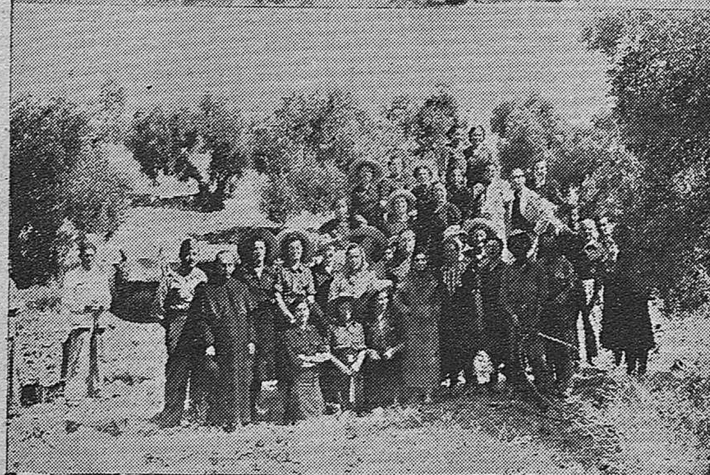
Nuestras camaradas de la "Hermandad de la Ciudad y el Campo" asistieron a un cursillo práctico sobre enfermedad del olivo, en la finca "Molino de San Andrés" en La Carlota.