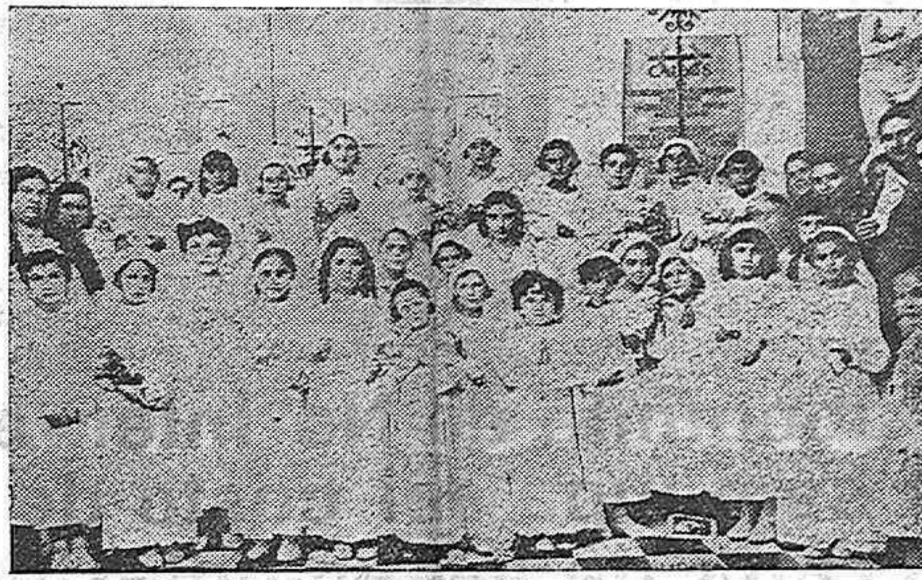
Las niñas pertenecientes a la Juventud de Acción Católica de San Nicolás, que hicieron su primera Comunión.