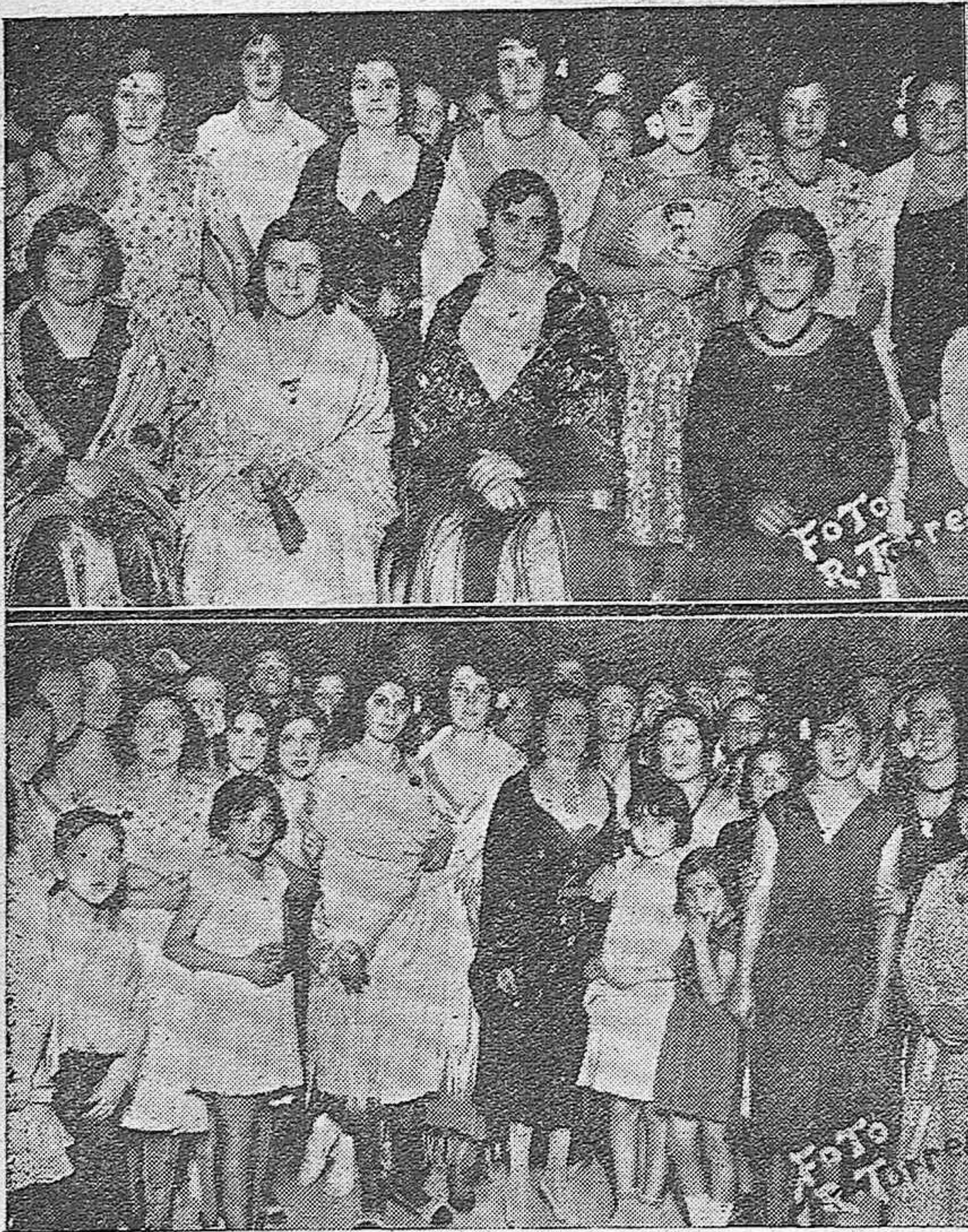
Grupos de bellas jóvenes que prestaron su valiosa colaboración como postulantes benéficas en la verbena de la Asociación de los ferroviarios y que con sus encantos pusieron la nota más alegre en tan simpática fiesta