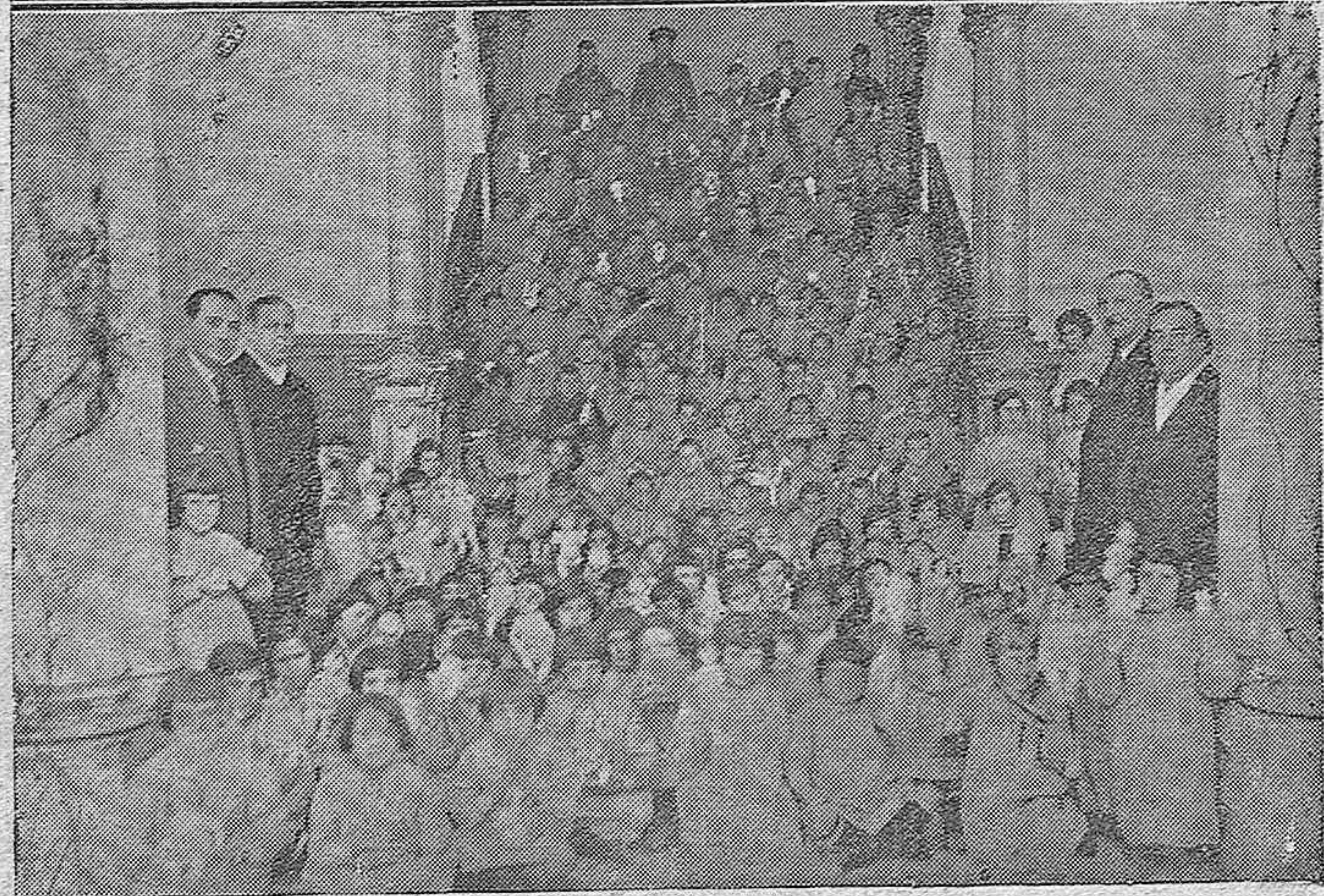
LA FESTIVIDAD DE LOS REYES MAGOS.—Dos momentos del reparto de juguetes a los acogidos en la Casa de Socorro Hospicio, acto al que asistieron el presidente, vicepresidente y un diputado de la Comisión gestora provincial