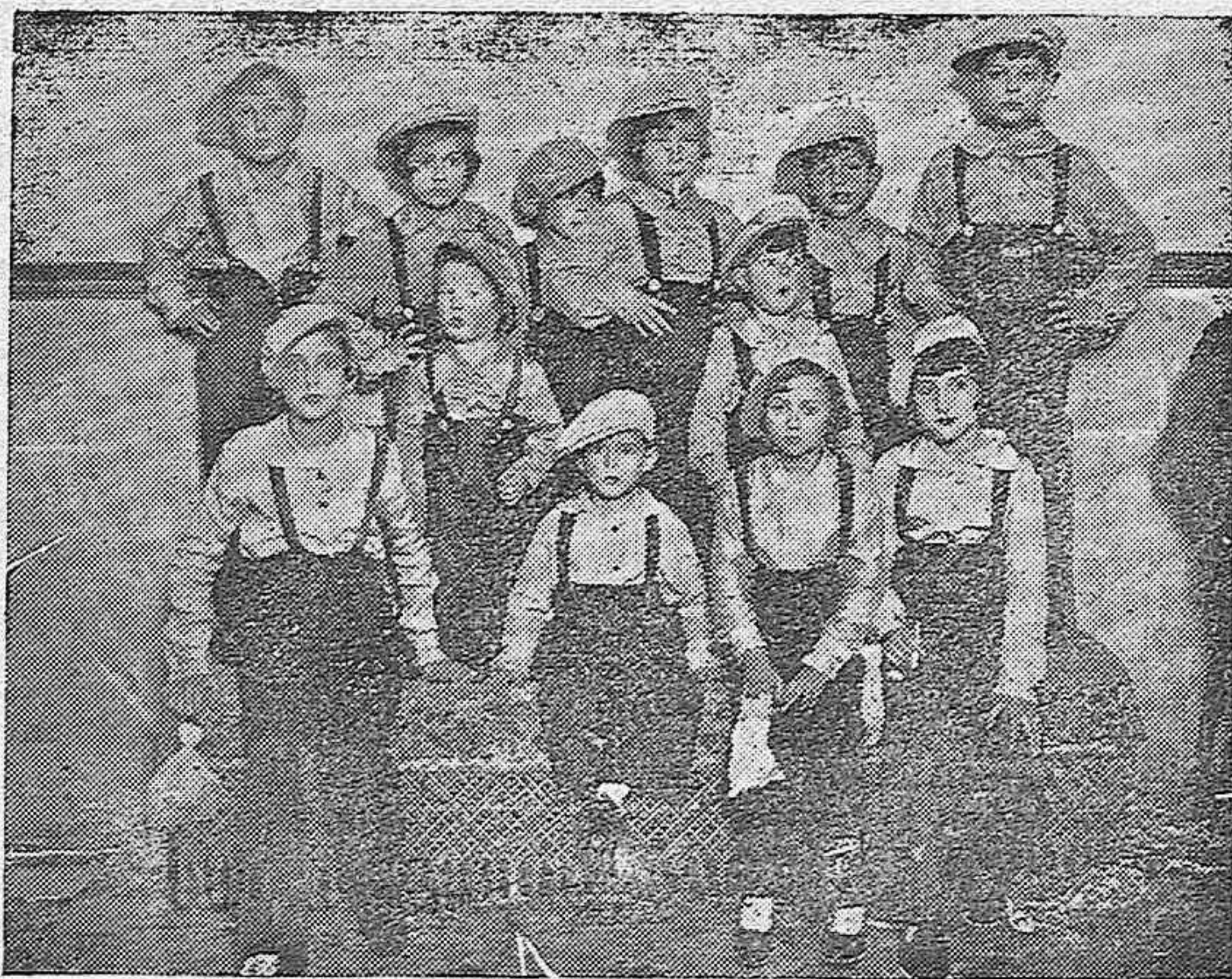
Dos minúsculos castigadores dando vida al “Pichi” de “Las Leandras” y que se distinguieron notablemente

Otro periodista le interrogó acerca de las dimisiones de los directores generales del ministerio de Agricultura y contestó que no se habían ocupado de ello porque el ministro no había dado cuenta de las dimisiones.