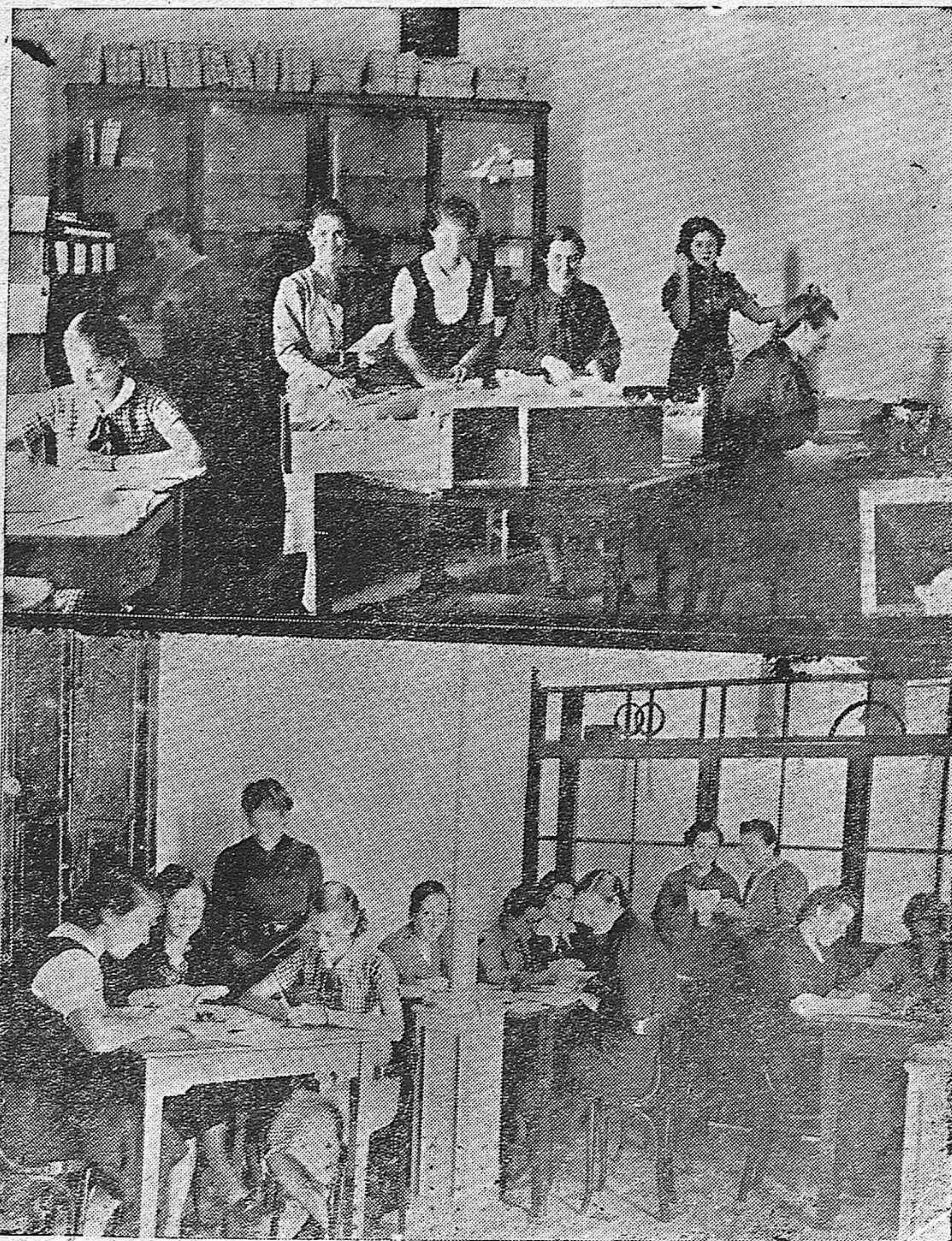
LA LABOR DE NUESTRAS CAMARADAS DE "FRENTE Y HOSPITALES".—"Frentes y Hospitales" está siempre en su tarea magnífica, en la noble y patriótica misión que se le ha confiado. He aquí a nuestras camaradas dedicadas por entero a la labor diaria