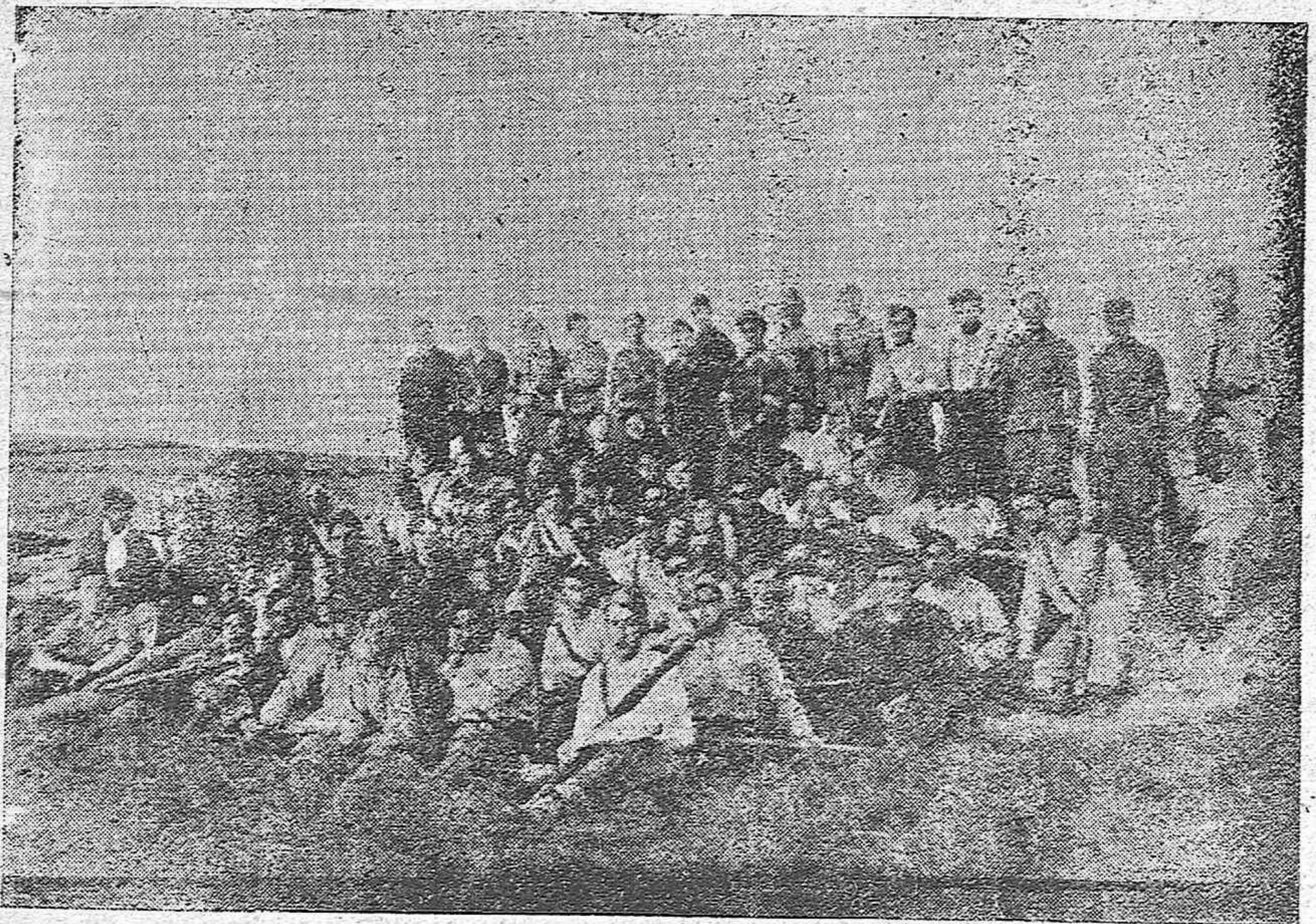
Los heroicos soldados nacionales, dan en los frentes, a diario, pruebas de su amor a España.-Un grupo de bravos falangistas que luchan con denuedo por la Patria.