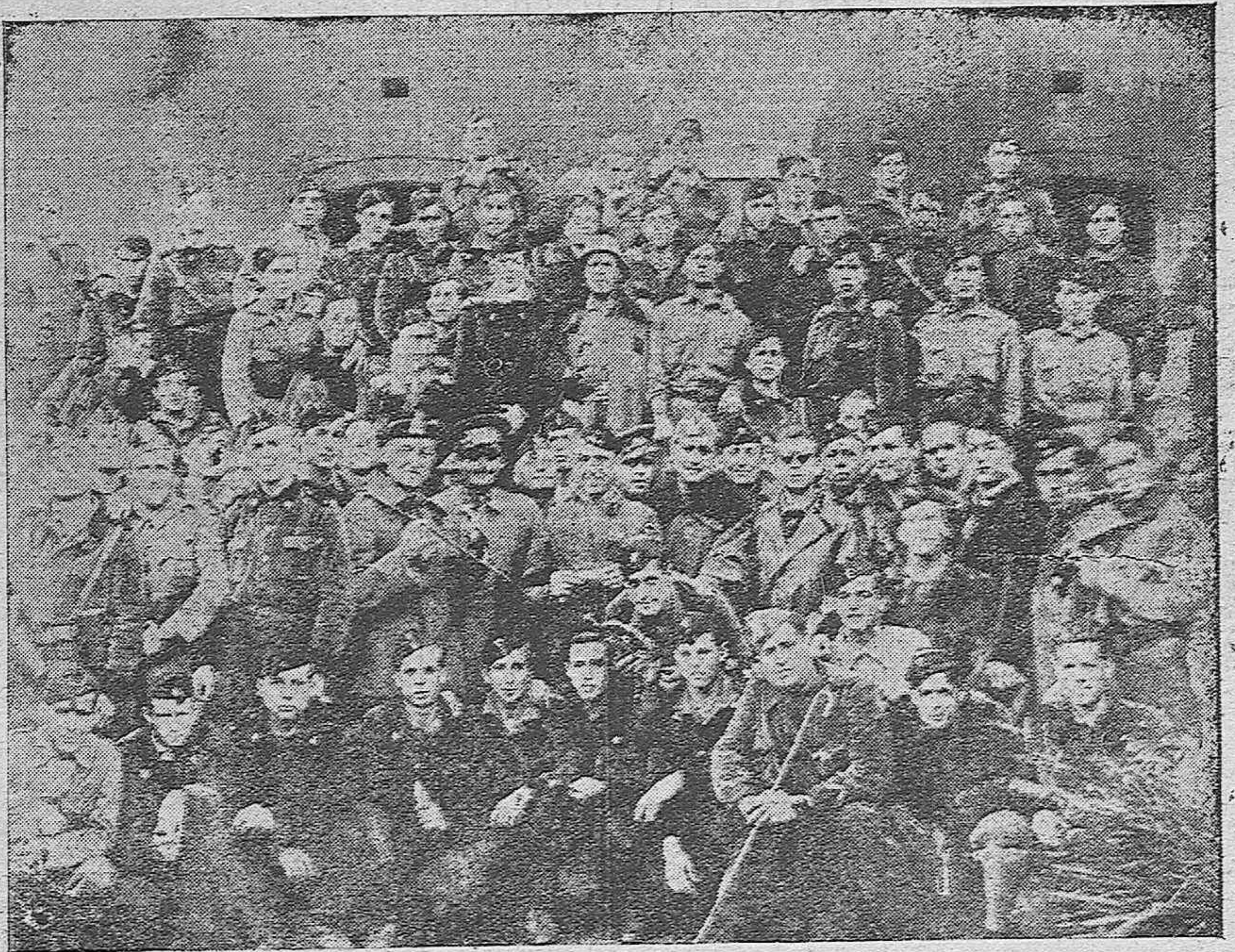
Los heroicos falangistas que forman el primer escuadrón de Caballería, organizado en Córdoba.

Solo la doctrina de Falange, puede vencer a marxismo. El ponerla en práctica es en nosotros cuestión de honor. Si nó, algún día se levantarán de sus tumbas nuestros muertos, y nos pedirán cuentas de como hemos administrado sus sacrificios.---JUAN YAGÜE.