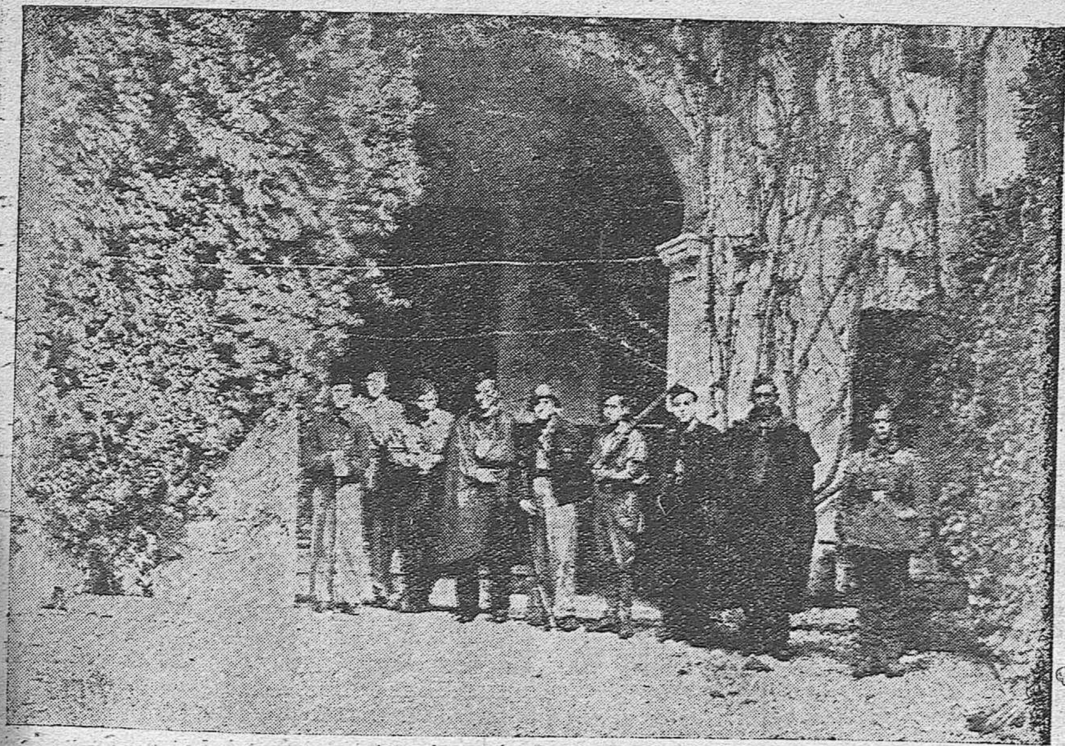
Entrada del Cuartel de Falange Española, en la calle de Manrique's.