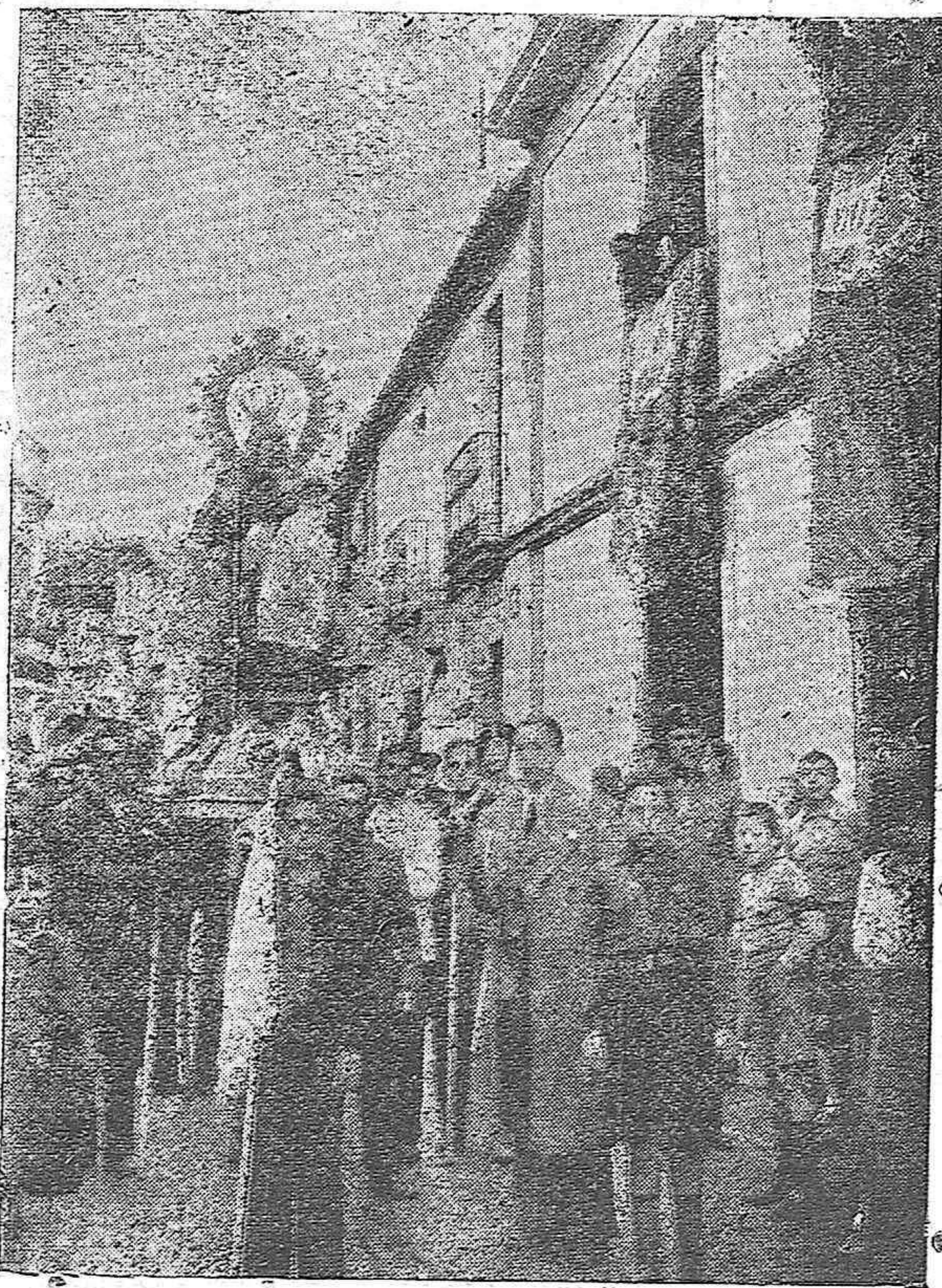
Nuestra Señora la Virgen de la Luz fué sacada procesionalmente, del templo de Santa Marina, después de haber sido éste restaurado y abierto al culto.—Un detalle del paso de la procesión por las calles del simpático y castizo barrio cordobés.