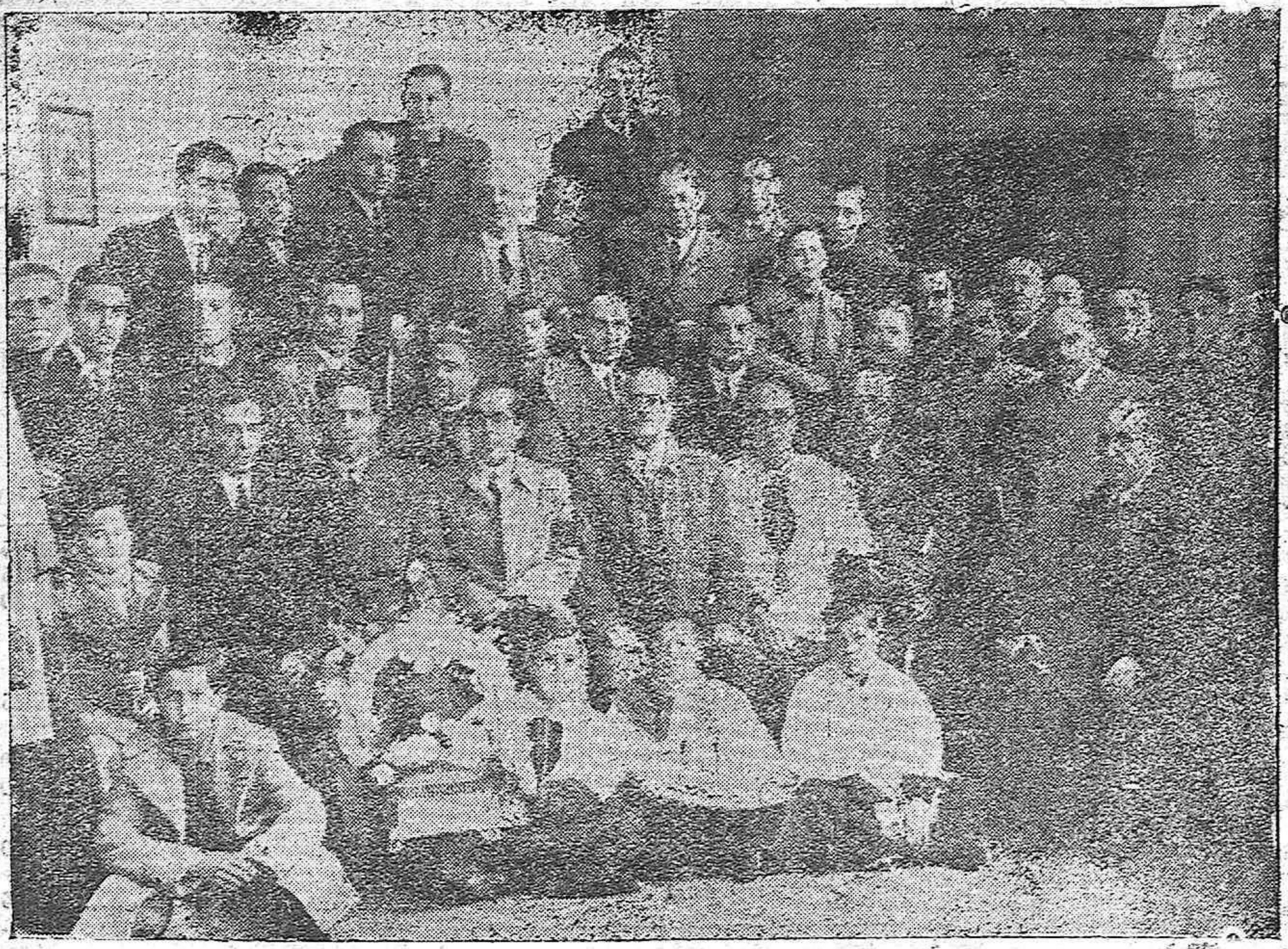
La fiesta de los Comerciantes a su Patrona la Virgen de la Candelaria, se ha celebrado en San Pablo, con la solemnidad de costumbre. Un grupo de los concurrentes al acto religioso, bajo la presidencia del alcalde de Córdoba D. José Castanyz Giménez