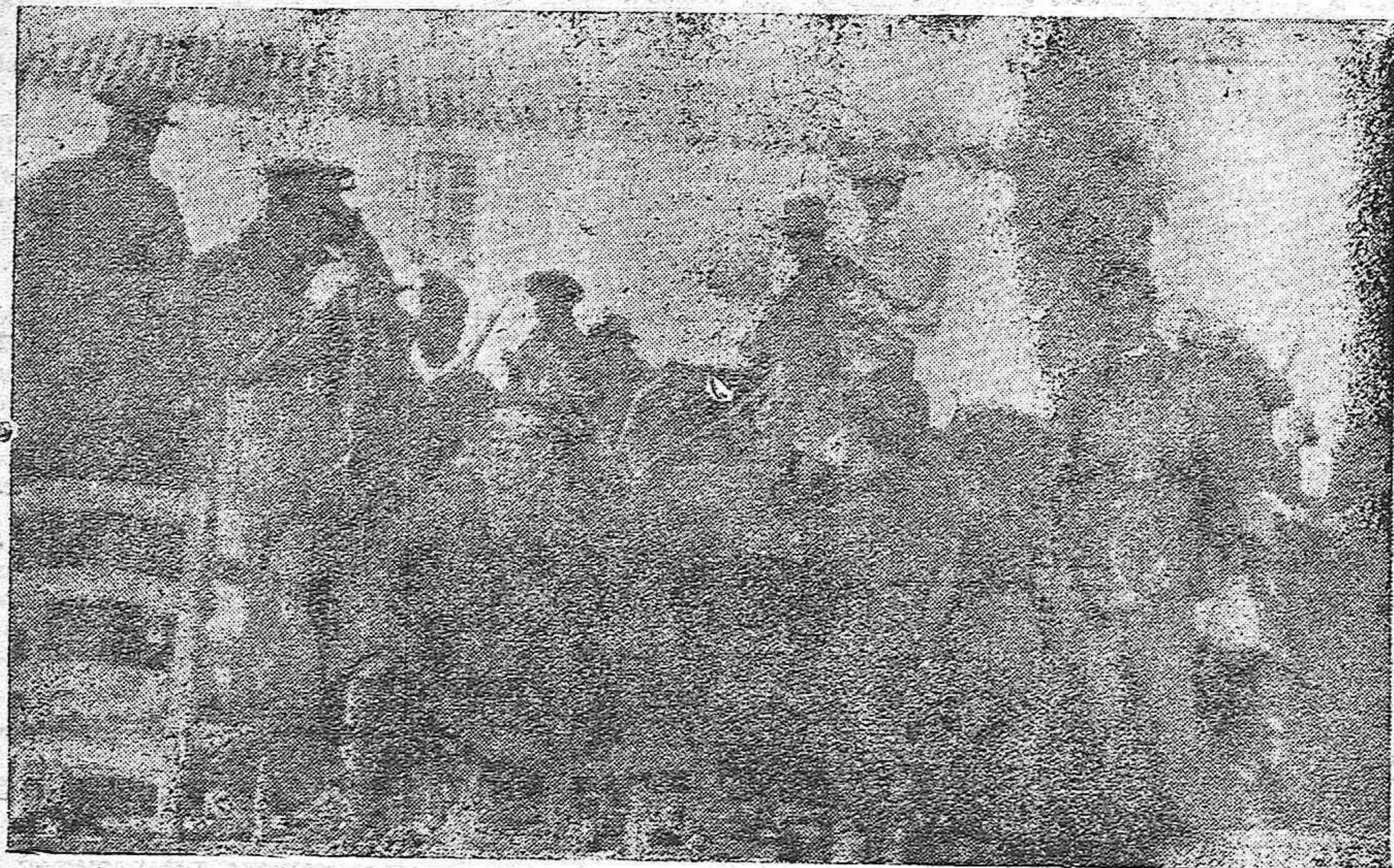
Un descanso en el frente, de las heroicas fuerzas que luchan por la santa causa de España.