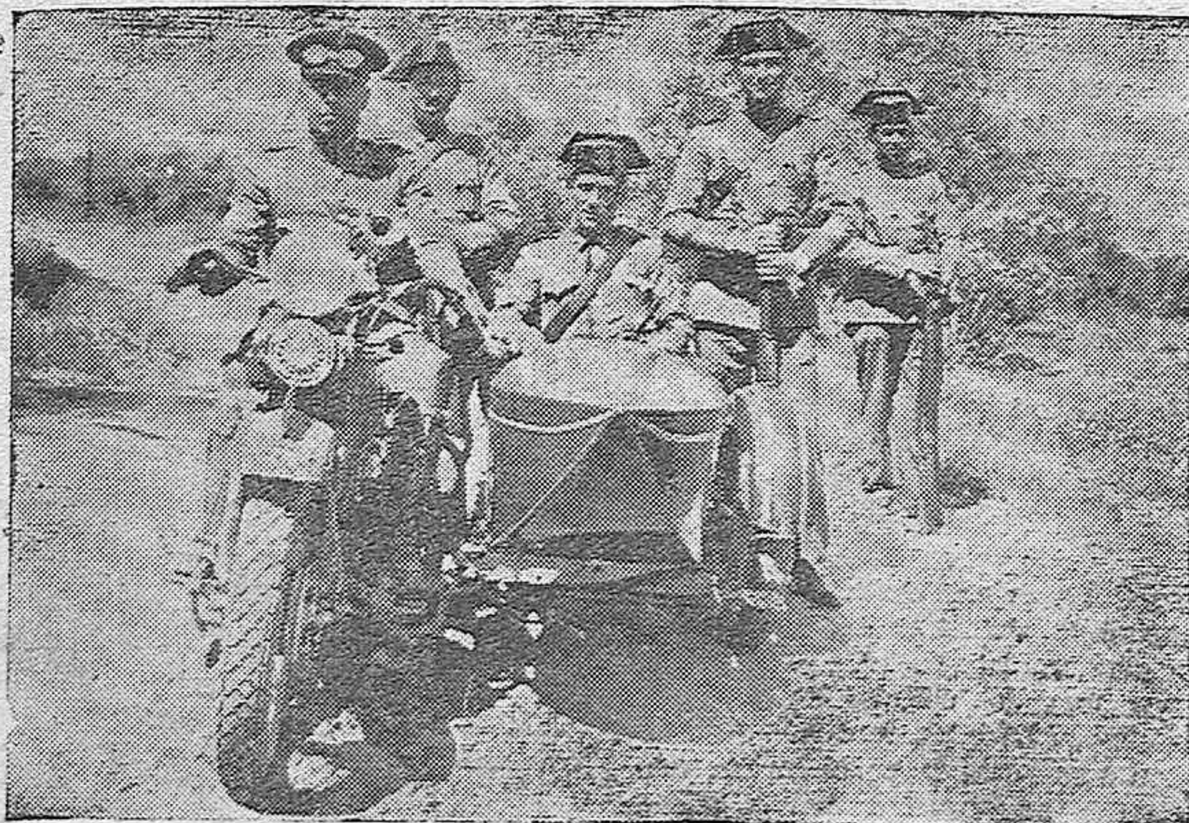
LA ESTANCIA DEL PRESIDENTE DE LA REPUBLICA EN "LA GINESA". Fuerzas de la Benemérita vigilando la finca, en la que S. E. el señor Alcalá Zamora ha pasado unos días