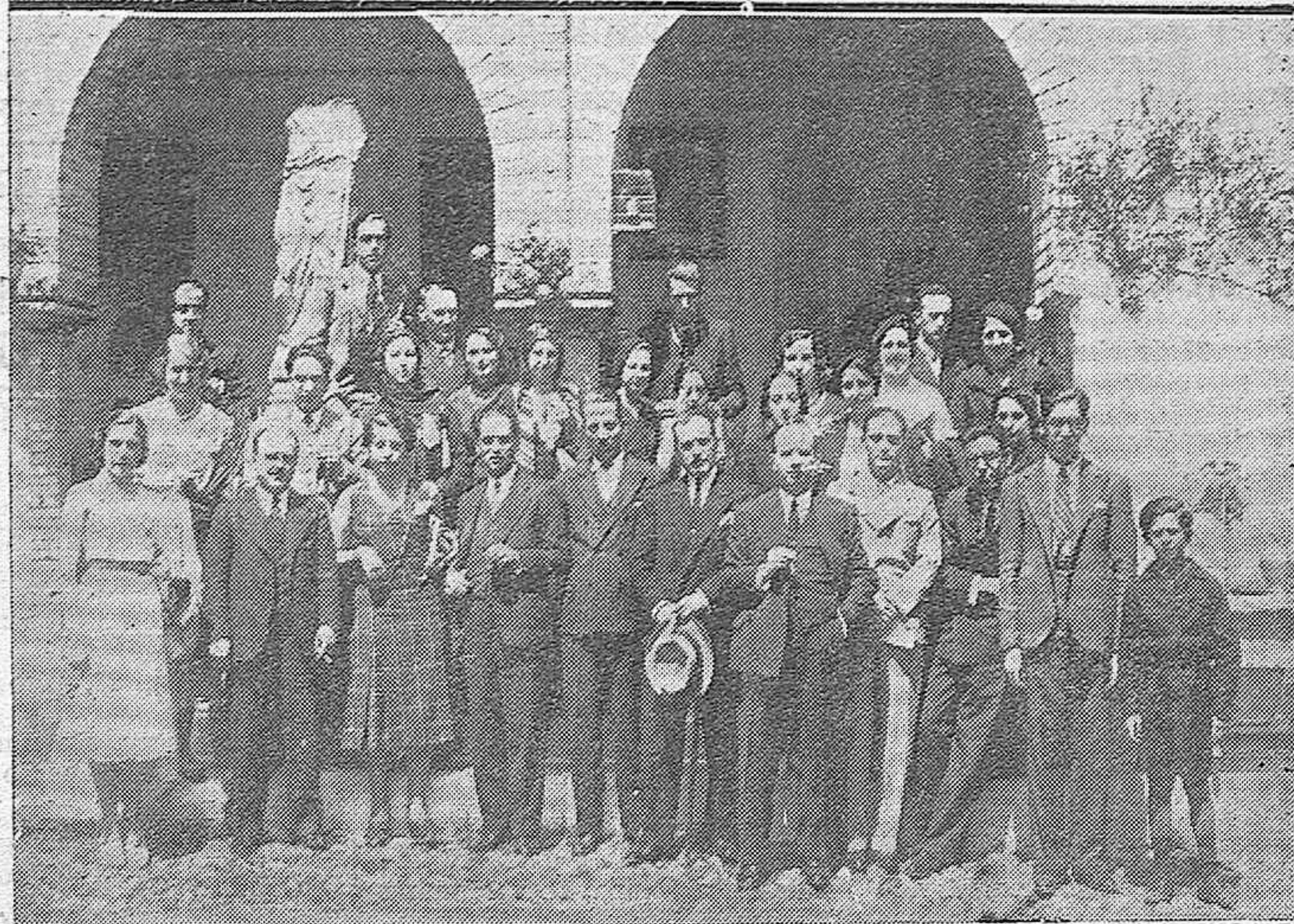
EN VIAJE DE ESTUDIOS.—Los estudiantes de la Universidad de Valladolid—huéspedes de la ciudad—durante las visitas a la Mezquita y Museo Arqueológico.