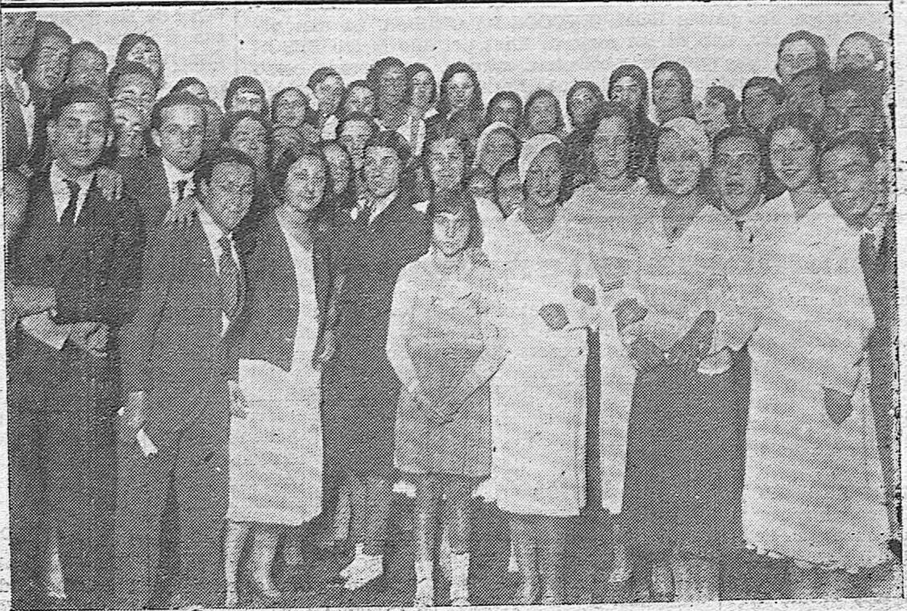
NOTAS GRAFICAS DE ACTUALIDAD.—Dos momentos del baile organizado por la F. U. E. en honor de sus lindas asociadas. A la fiesta asistieron numerosas y bellisimas muchachas.