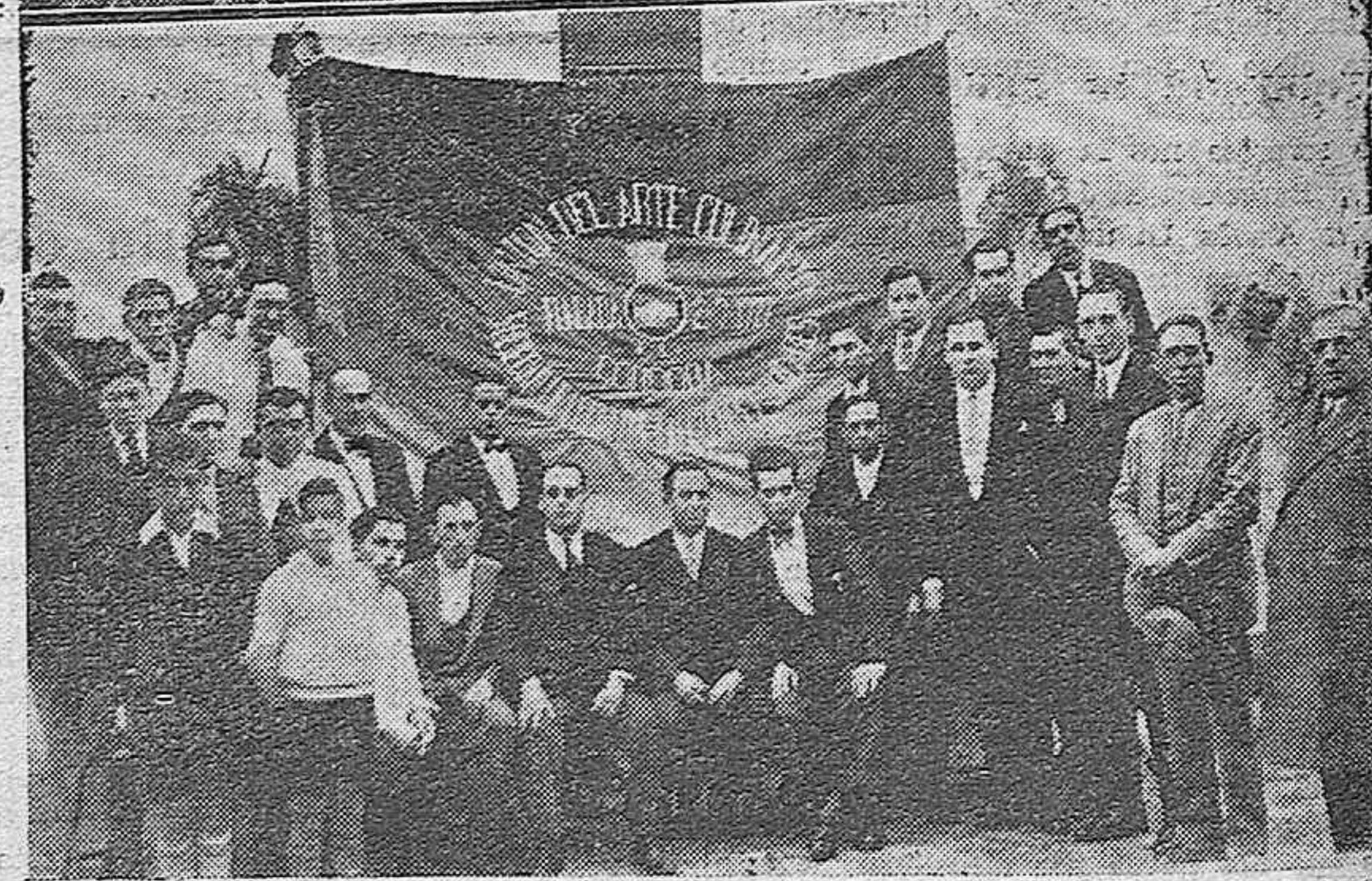
Jóvenes de la sociedad cordobesa reunidos ayer en una gira campestre con la que celebraron el resultado de una labor altruista en favor de muchos desvalidos.—Presidencia y afiliados de la Unión del Arte Culinario reunidos con motivo de la toma de posesión de la nueva directiva