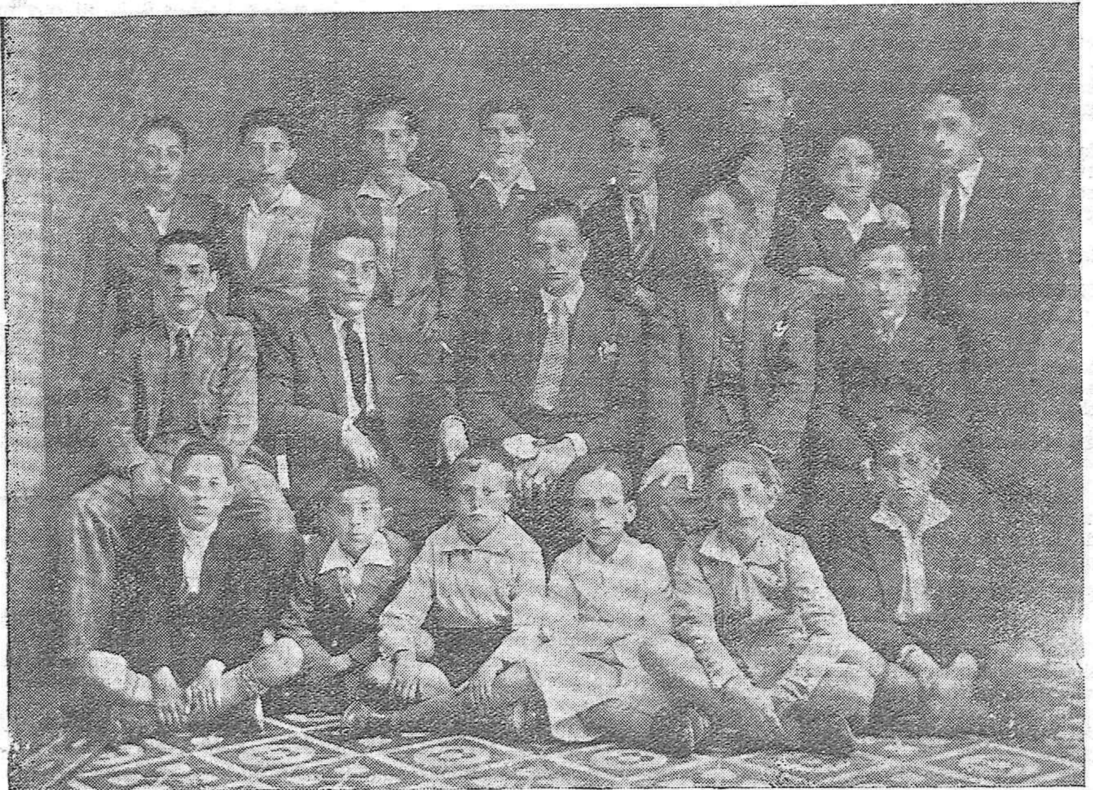
CENTROS CULTURALES DE LA PROVINCIA.—Pozoblanco: Profesores y alumnos de la nueva Academia de Enseñanza Elemental y Superior establecida en dicha importante ciudad del Valle de los Pedroches