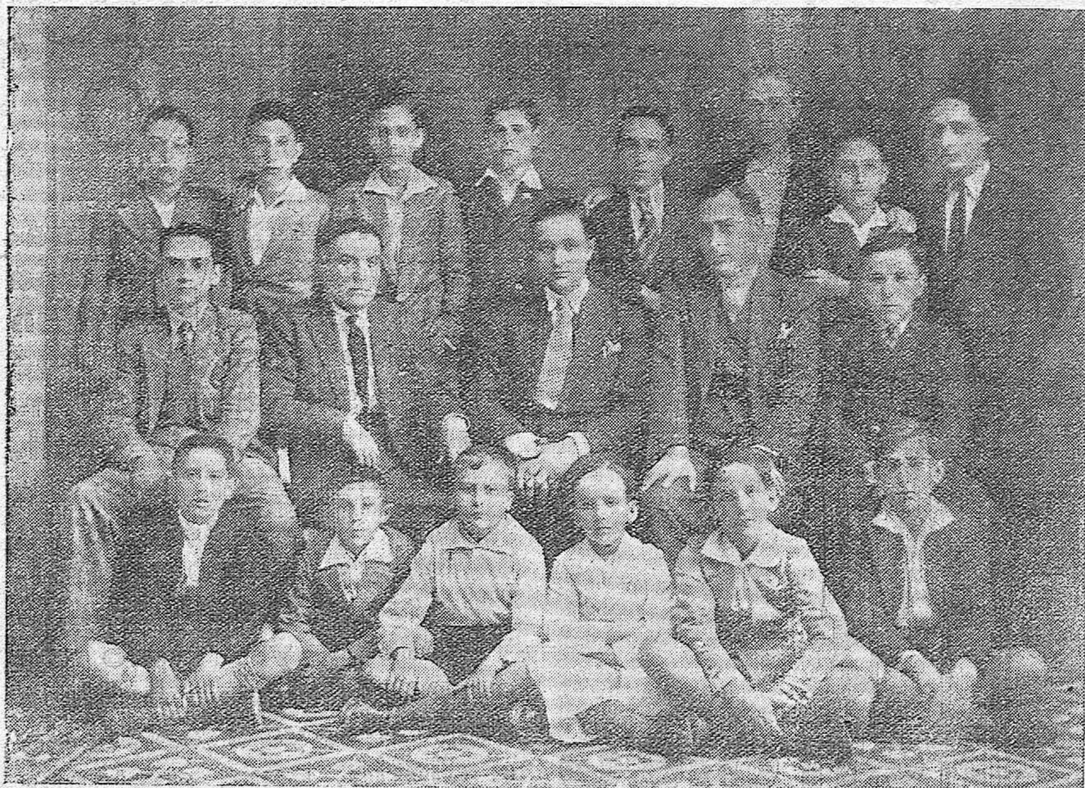
CENTROS CULTURALES DE LA PROVINCIA.—Pozoblanco: Profesores y alumnos de la nueva Academia de Enseñanza Elemental y Superior establecida en dicha importante ciudad del Valle de los Pedroches