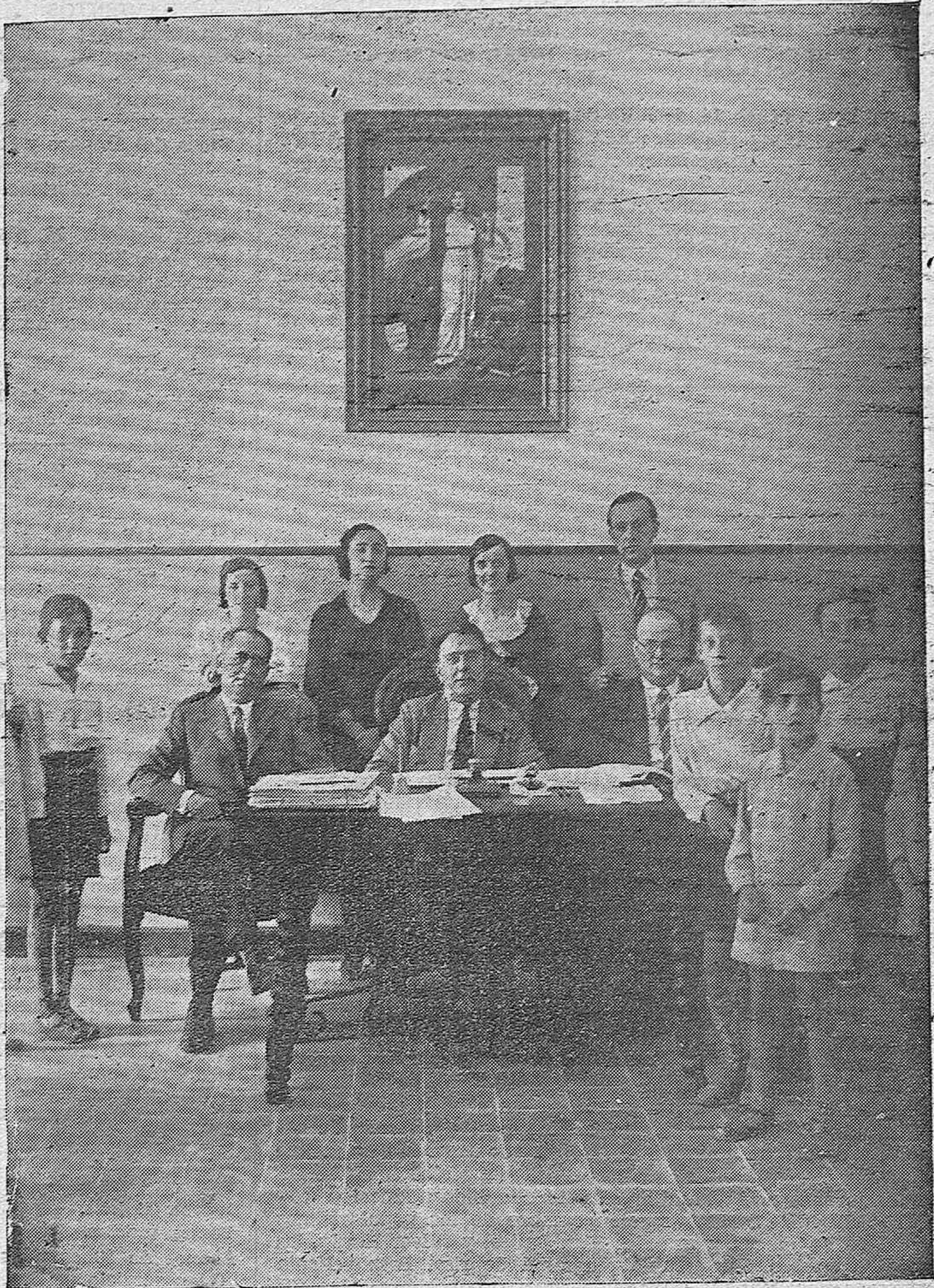
ACTUALIDAD GRAFICA. —En el Grupo escolar Colón se ha verificado esta mañana el reconocimiento de los niños que aspiran a formar parte de las Colonias marítimas.—He aquí a los pequeños con sus profesoras y con los médicos encargados de declarar la aptitud