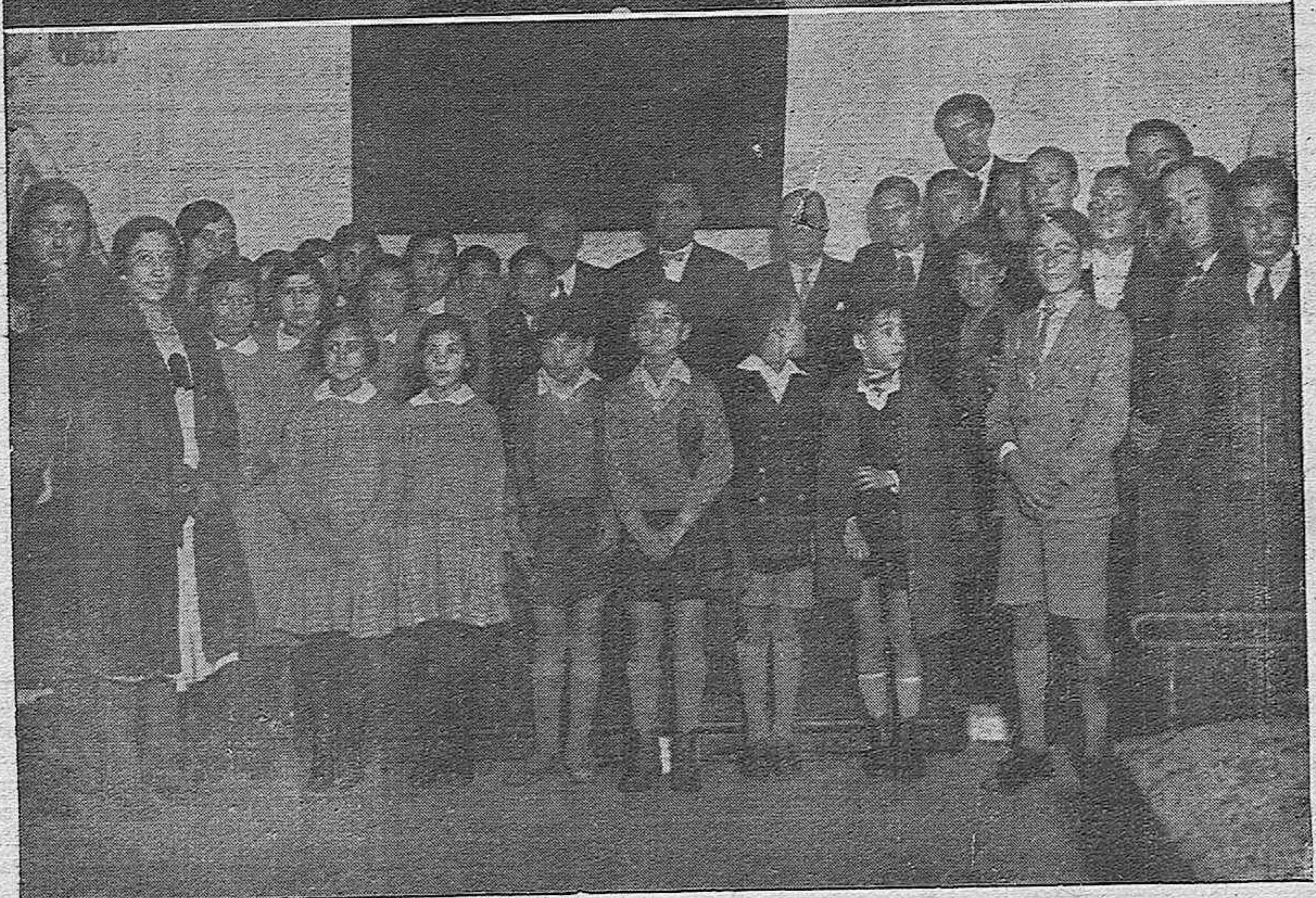
CLAUSURA DE UNA EXPOSICION DE ARTE.—Miembros de la Junta Asesora para la clasificación de los expositores. El presidente de la Comisión gestora rodeado de los pensionados y aspirantes que concurrieron al acto de clausura