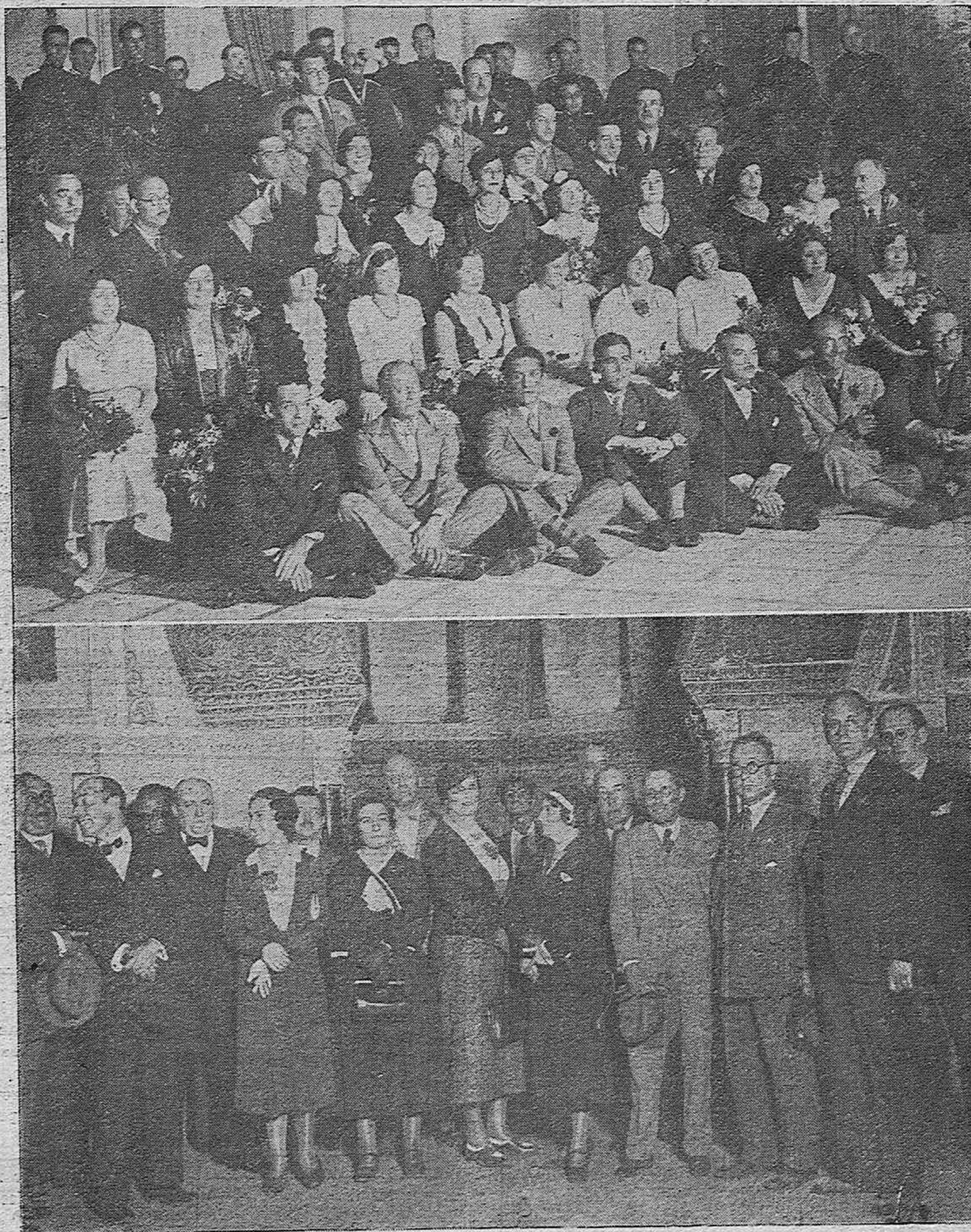
LOS CONGRESISTAS POSTALES PANAMERICANOS.—Grupo de concurrentes a' vino de honor, con que fueron obsequiados en el Círculo de la Amistad.—Miembros del Congreso Postal Panamericano celebrado en Madrid, en su visita al Mirhab de la Mezquita.