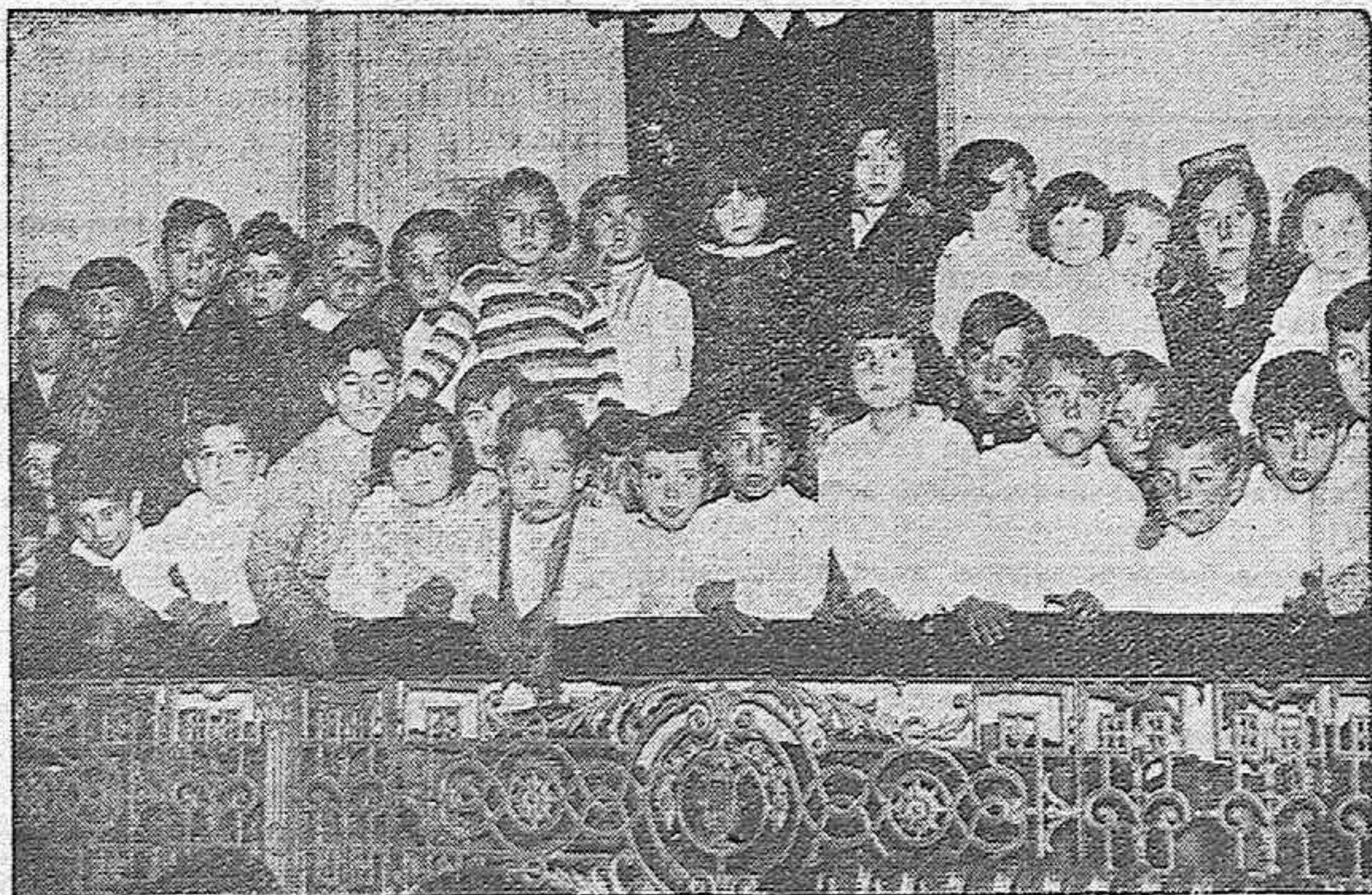
Una platea del Gran Teatro ocupada por parvulitos de ambos sexos, en la función de cinematógrafo celebrada en obsequio de los niños.