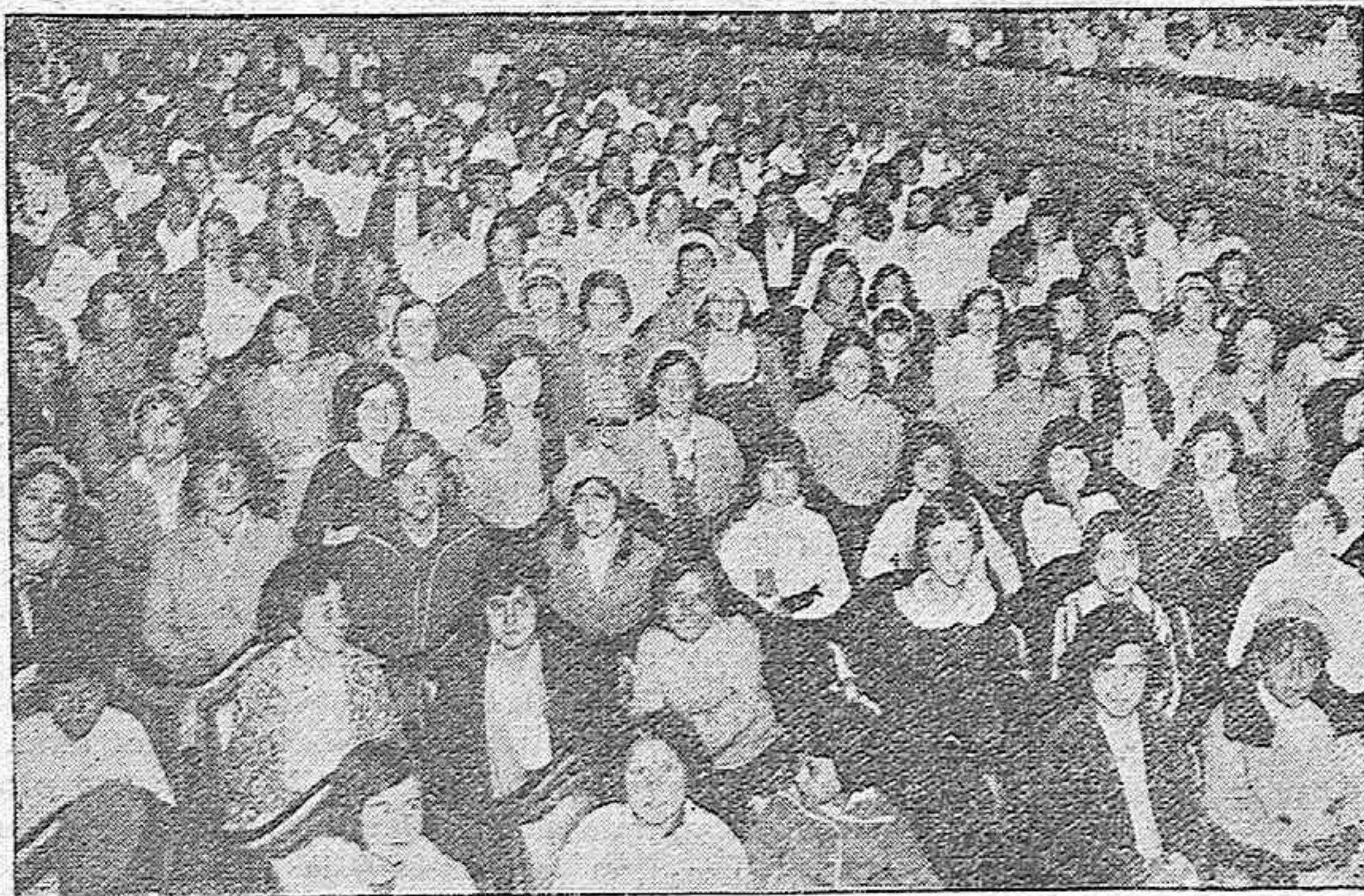
DESPUES DE LA PROCLAMACION DE PRESIDENTE.—Aspecto parcial de la sala del Gran Teatro, durante la fiesta de cine celebrada esta mañana en obsequio de los niños de las Escuelas Nacionales.

OCASION: Abrigos lana color cortos para señora, desde 2,50 pesetas, y negros desde 3 pesetas, en EL METRO y también en sus tres sucursales