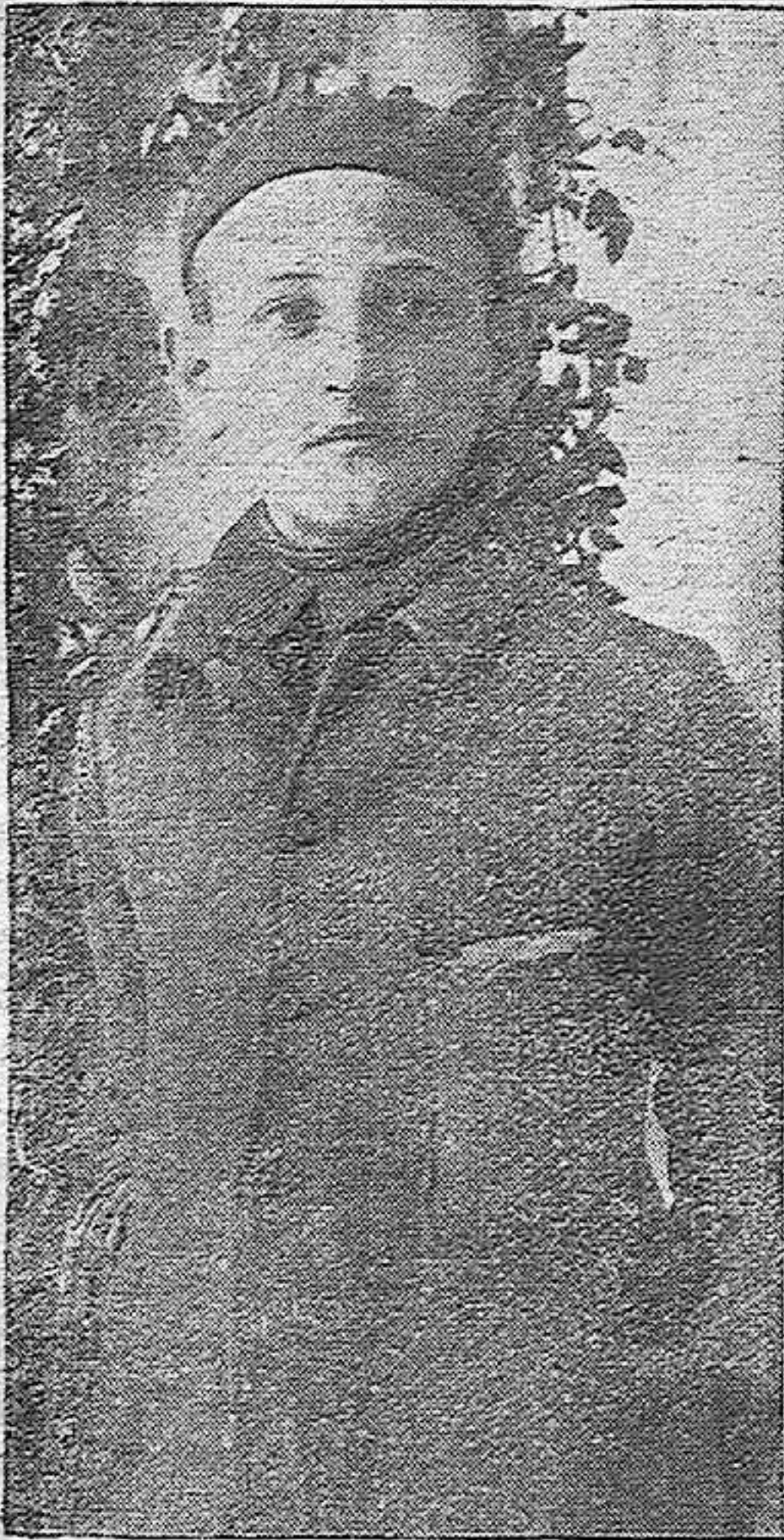
¿COMO VIVEN LOS NIÑOS DEL HOSPICIO?

DOS HORAS EN EL HOSPICIO. COMO VIVEN LOS ASILADOS. LO QUE COMEN; LO QUE JUEGAN; LO QUE TRABAJAN. LOS NIÑOS QUE MUEREN. UN DETALLE DE LA COMIDA. NUESTRA IMPRESIÓN.